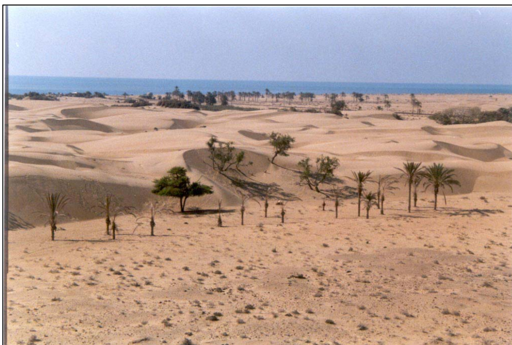
شکل ۳- تپه‌های ماسه‌ای برخان در منطقه درک، در حال تجمع و تبدیل به نوع Draa هستند.

تپه‌های ماسه‌ای به شکل برخان نیز دچار شدیدترین تغییرات در جهت کاهش پراکنش و گسترده‌گی شده، به طوری که ۲۲۸۶ هکتار از آنها عمدتاً تغییر شکل یافته‌اند (نمودارهای شماره ۱ و ۲). این واحد فقط در غرب سواحل سیستان و در شمال خورهای کرتی، گالک و درک (نگاره شماره ۳) گسترش داشته و عمده تغییرات نیز در همین منطقه بوده است. در این مناطق برخان‌ها تحت تأثیر فرسایش بادی و انتقال رسوبات تبدیل به Draa و Qssh شده است و در محل‌هایی نیز کاملاً محو شده و زمینه زیرین یا پهنه‌های گلی قدیمی (Qm) نمایان شده است.