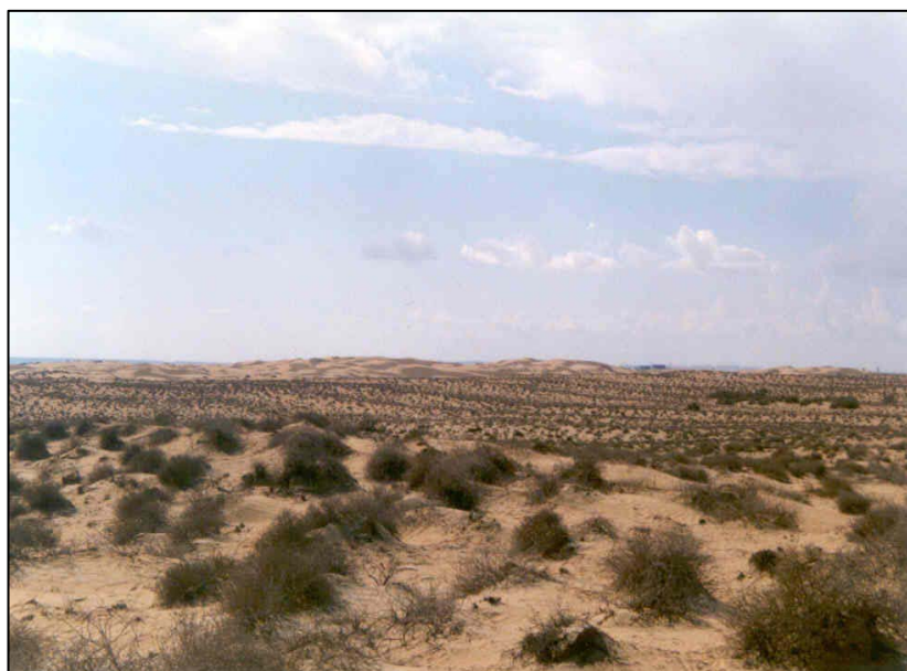
شکل ۱- تپه‌های ماسه‌ای پناهگاهی در منطقه خلیج چابهار