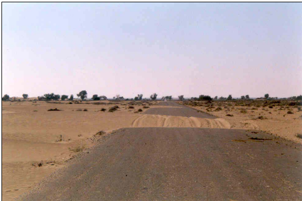
شکل ۵- حرکت ماسه‌های روان یکی از تغییرات مخرب تپه‌های ماسه‌ای

ساحلی را اشغال کرده (شکل شماره ۵) به طوری که حدود نیمی از ۲۷۴۳ هکتار افزایش آن مربوط به این فرآیند بوده و بخشی از آن متوجه فرسایش تپه‌های ماسه‌ای طولی و تبدیل آن به صورت این پهنه‌ها بوده است. در شمال کنارک پهنه‌های ماسه‌ای به طور گسترده جایگزین پهنه‌های گلی (Qm) شده است.