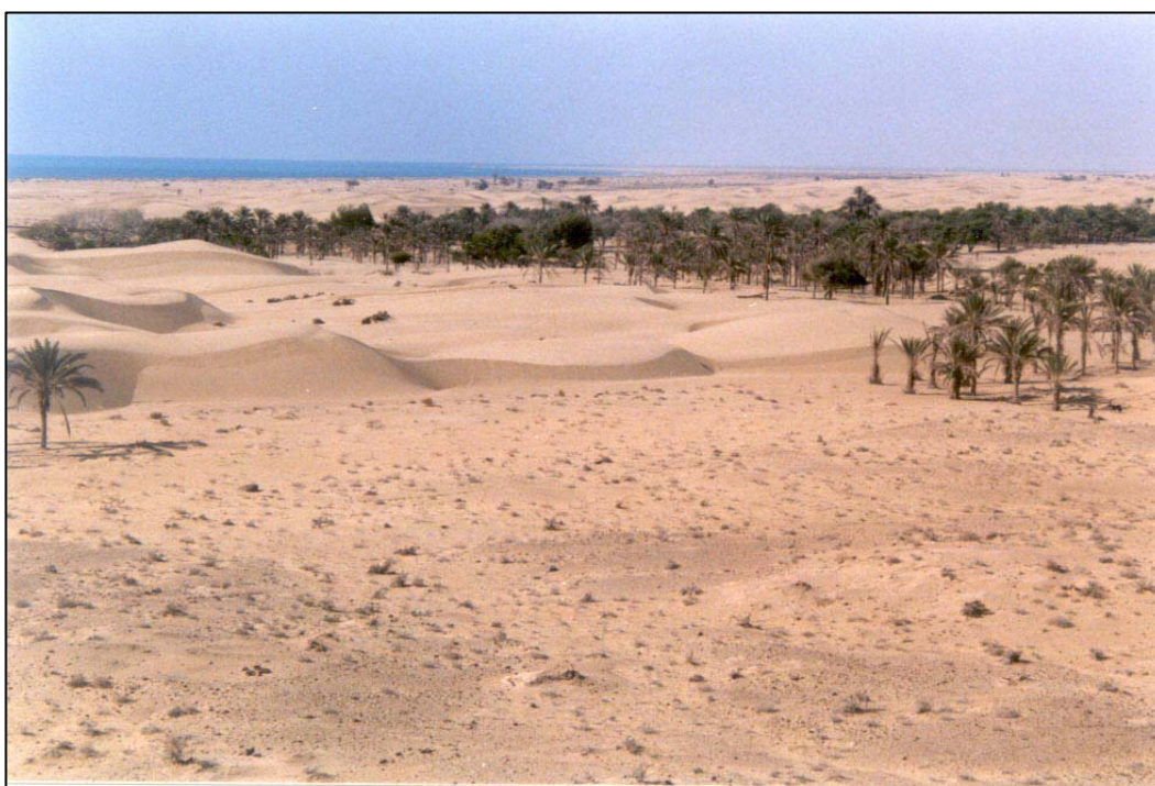
شکل ۶- فرسایش تپه‌های ماسه‌ای و توسعه پهنه‌های ماسه‌ای