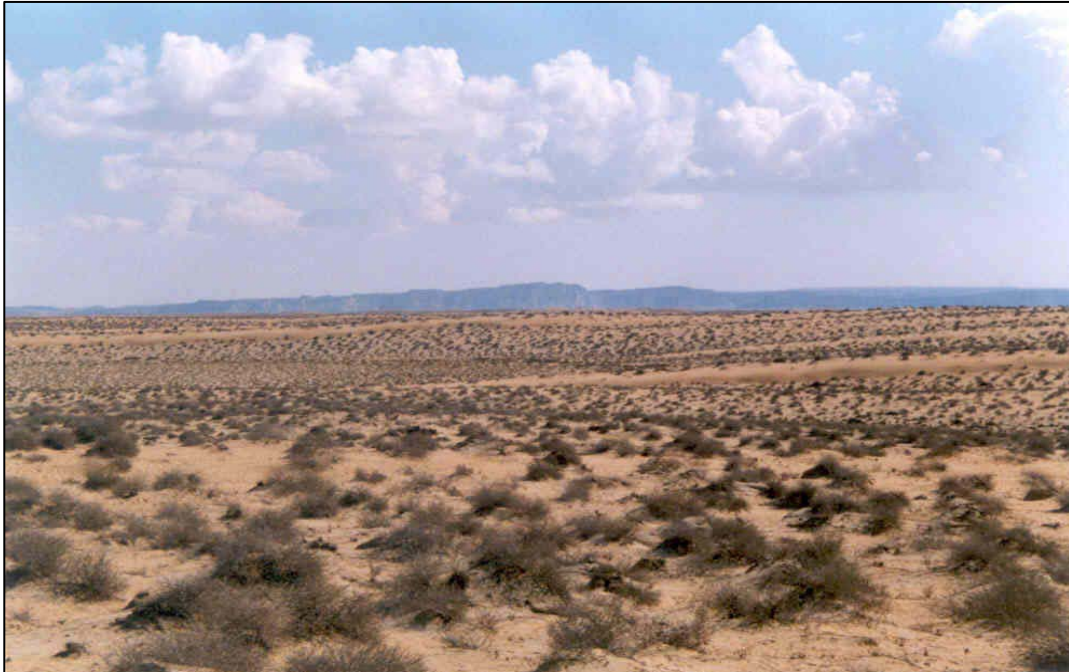
شکل ۴- تپه‌های ماسه‌ای طولی یا سیف در منطقه خلیج چابهار