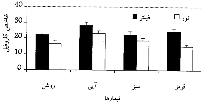
شکل ۱- شاخص کلروفیل در برگهای کاهو در تیمارهای مختلف نوری