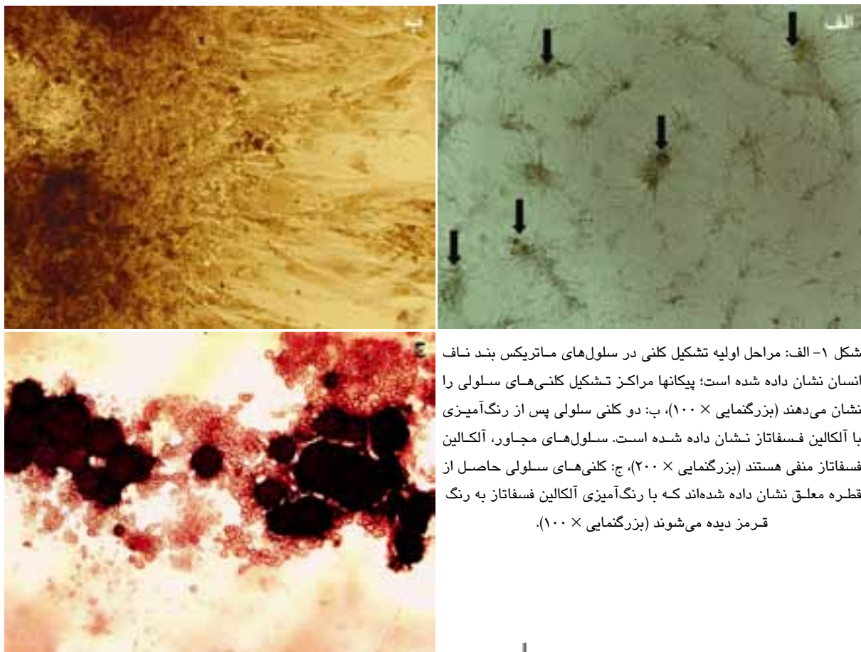
شکل ۱- الف: مراحل اولیه تشکیل کلنی در سلول‌های ماتریکس بند ناف انسان نشان داده شده است؛ پیکانها مراکز تشکیل کلنی‌های سلولی را نشان می‌دهند (بزرگنمایی \times 100 )، ب: دو کلنی سلولی پس از رنگ‌آمیزی با آلکالین فسفاتاز نشان داده شده است. سلول‌های مجاور، آلکالین فسفاتاز منفی هستند (بزرگنمایی \times 200 )، ج: کلنی‌های سلولی حاصل از قطره معلق نشان داده شده‌اند که با رنگ‌آمیزی آلکالین فسفاتاز به رنگ قرمز دیده می‌شوند (بزرگنمایی \times 100 ).