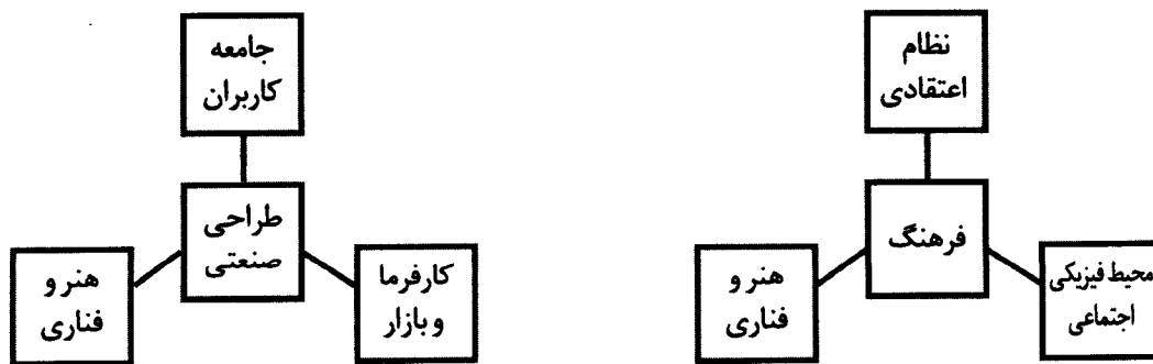
نمودار شماره ۱. مقایسه مؤلفه‌های تاثیر گذار بر فرهنگ و طراحی صنعتی

این همانندی‌ها صرفاً به حوزه اثرگذاری محدود نمی‌شود، بلکه اشتراکات عمیقی میان ریشه‌های طراحی صنعتی و فرهنگ قابل تعریف است: