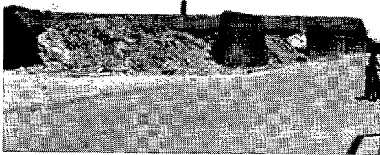
تصویر شماره ۲: منظر واحدهای چرم سازی متروک

منظر: منظر موجود مجموعه ای از عوامل طبیعی مانند چشم انداز ارتفاعات شرق تهران، بی بی شهربانو، البرز و پوشش های گیاهی کارخانجات بزرگ به همراه عناصر و عوامل انسان ساخت از قبیل عناصر شاخص عمودی کارخانجات (دودکش ها و منابع هوایی آب)، حصارهای آجری ممتد، دروازه ها و ورودی کارخانه ها و تاسیساتی نظیر حوضچه های رسوبی، جرثقیل های سنگبری ها، و حوضچه های خنک کننده می باشد. بنا های صنعتی عمدتاً آجری با بام شیروانی در میان قطعات وسیع زمین قرار گرفته اند. بطور کلی به دلیل ارتفاع کم بدنه ها به نسبت عرض خیابان گشادگی و عدم محصوریت فضا محسوس است. کیفیت منظر در بخش های غرب منطقه به دلیل حضور کارگاه های فرسوده، اغتشاش و خط آسمان بسیار یکنواخت نامطلوب است (تصویر شماره ۲). مناظر جنوب حوزه به واسطه تمرکز بیشتر عناصر شاخص و تلفیق حصار های بلند کارخانجات با پوشش های گیاهی درون محوطه، خط آسمان متنوع و تداوم حصار کارخانجات کشش بصری مطلوبی را ایجاد می نماید.