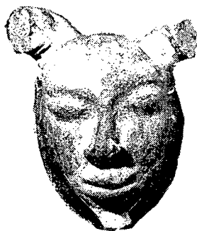
تصویر ۳ - صورتک نمایشی از مهجودارو