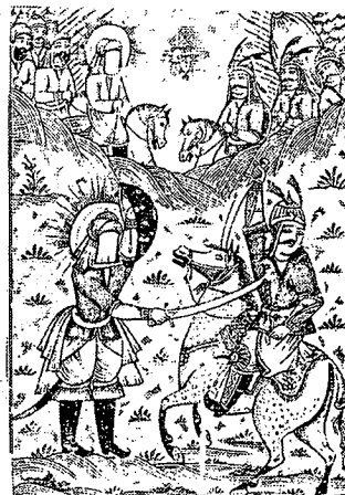
تصویر ۴- نسخه افتخار نامه حیدری، ۱۳۱۰ هـ.ق چاپ سنگی

۱- آثار مربوط به شخصیت و داستان‌های پیرامون زندگی پیامبر اکرم و اهل بیت علیه‌السلام مانند: حمله حیدری که اولین نسخه مصور آن در سال ۱۲۶۴ هـ.ق منتشر شد و اسرار الشهدا که اولین نسخه مصور آن به سال ۱۲۶۸ هـ.ق چاپ شد و طوفان البکاء که اولین نسخه مصور آن به سال ۱۲۷۲ هـ.ق منتشر شد. اکثر تصویرسازی‌های این نسخه‌ها اثر میرزا علیقلی خوئی از بهترین نقاشان چاپ سنگی این دوره است. از نمونه‌های بارز این آثار می‌توان کتاب افتخار نامه حیدری را نام برد. متن این کتاب در ستایش حضرت امیرالمؤمنین علی (ع) و شرح حالات و فتوحات ایشان است که در دوره ناصری - به شیوه رزم خوانی و حماسی - سروده شده است. این کتاب دو جلد است و به تاریخ ۱۳۱۰ هـ.ق.