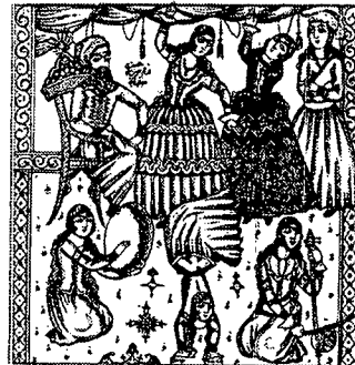
تصویر ۵- نسخه هزارویکشب، ۱۲۷۲ هـ. ق، چاپ سنگی

مجموعه قصه های هزارویک شب که باشگرد قصه درقصه نوشته شده است، یکی از پیچیده ترین متن های ادبی به شمار می آید. از این نسخه بین سال های ۱۲۷۲ هـ. ق تا ۱۳۲۰ هـ. ق دست کم هفت نسخه مصور منتشر شده است (Marzolph, 2001, P.25). این کتاب از زمان قاجار به بعد توسط مصوران مختلف و با شیوه های گوناگون تصویرسازی شده است. یکی از این نسخه ها چاپ سال ۱۲۷۲ هـ. ق است و تصویرگران میرزا رضاتبریزی است. نسخه دیگری که به شیوه چاپ سنگی منتشر شده، بدون تاریخ است و تصاویر آن امضای میرزا حسین اصفهانی را دارد (محمدی - قائینی، ۱۳۸۱، ص ۱۱۴). تصویرگر در این اثر چهره های زنان و مردان را کاملاً قاجاری طراحی کرده و بابالو پایین قراردادادن