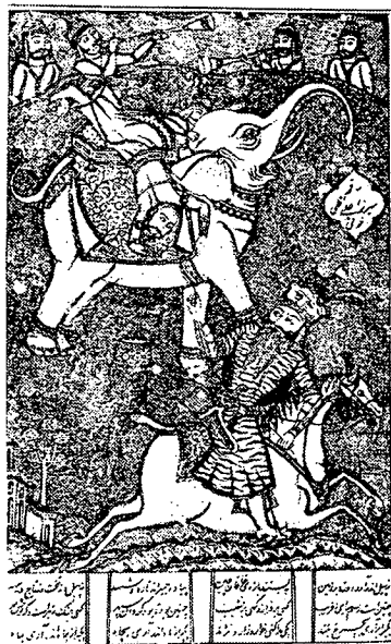
تصویر ۱- نسخه شاهنامه فردوسی، ۱۲۶۵ ه.ق، تهران

اولین نسخه‌های چاپ سنگی شاهنامه در هندوستان در سال‌های ۱۲۶۲ ه.ق و ۱۲۶۶ ه.ق به چاپ رسیدند. همچنین اولین شاهنامه به همین شیوه در محرم سال ۶۷ - ۱۲۶۵ ه.ق در تهران به خط نستعلیق و قطع رحلی در ۵۹۵ ورق چاپ شد (تصویر ۱) (افشار، ۲۵۳۵، صص ۷-۱۳). اشعار این شاهنامه در چهار ستون نوشته شده و مصور است و تصویرگر آن علیقلی خوئی است. با بررسی تصاویر این دو نسخه پی‌می‌بریم که تصویرسازی نسخه‌های چاپ سنگی ایران در ابتدا تحت تأثیر تصاویر نسخه‌های چاپ شده در هندوستان بوده است.