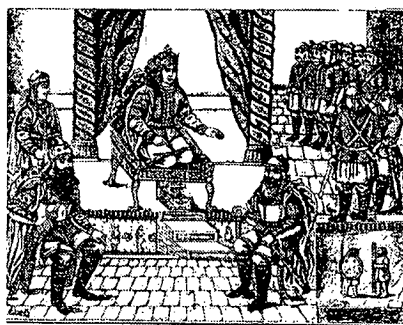
تصویر ۲ - نسخه شاهنامه فردوسی مشهور به شاهنامه امیر بهادر، ۱۳۲۲ تا ۱۳۲۶ ه.ق، تهران، چاپ سنگی

امیر بهادر جنگ تهیه و چاپ شد، شاهنامه معروف به امیر بهادر و به قطع سلطانی است. ساخت این شاهنامه تقریباً چهار سال یعنی میان سال های ۱۳۲۲ تا ۱۳۲۶ ه.ق به طول انجامید. به همین جهت به تصویرهای مظفرالدین شاه و محمدعلی شاه مزین است و در انتهای کتاب تصویری از امیر بهادر آمده است. این نسخه شش ستونی و مصور است. همچنین به خط خوشنویس معروف، عمادالکتاب مزین شده است (افشار، ۲۵۳۵، ص ۱۴) (تصویر ۲).