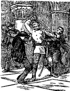
مُعَلِّمُ بِنْتِ دُرْمَنان- تصویر ۷- نسخه کنت مونت کریستو، ۱۳۲۲ هـ. ق، تهران، چاپ سنگی

معمولاً تصویرسازی این نوع کتاب ها، به صورت کپی برداری از تصاویر نسخه اصلی صورت