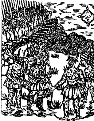
تصویر ۶- نسخه امیرارسلان، ۱۳۱۷ هـ. ق، تهران، چاپ سنگی

و تصویرگر با تکرار خطوط و پیکره های سوار بر اسب بر تحرک و پویایی تصاویر کمک کرده است (تصویر ۶).