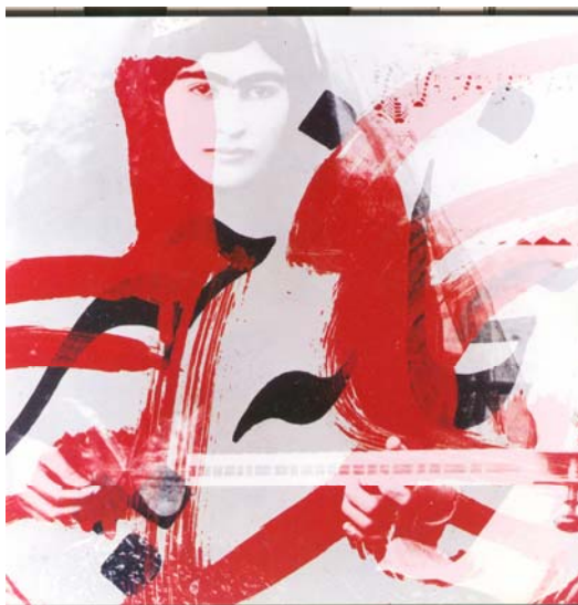
بهمن جلالی، تصویر تخیل، ۱۳۸۲