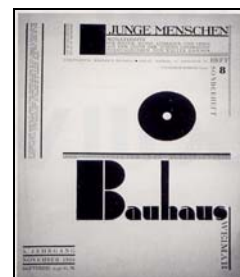
برای کتاب باو هاوس)