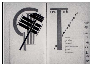
( تصویر ۶ ال لیسیتزکی- برای کتاب مایا کوفسکی )

نمونه دیگر استفاده از نوشتار در نقاشی در جهت نشان دادن اهداف هنری پاپ آرت، منظور گشت. در اثری از ریچارد همپلتون ۱۰ بنام "چه چیزی