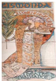
(تصویر ۱۱- موشا. آرت نوو)

این سبک در واقع احیاگر سبک تزئینی و قرون وسطا بود و هدف آن نمایش ارزش های تزئینی خطوط منحنی بود؛ چه در هیئت خطوط پر پیچ و خم گل و گیاه، و چه به شکل خطوط هندسی. ویژگی عمده این سبک، کاربرد خطوط سینوسی و پر انحنای نامتقارن به تقلید از نقوش پر پیچ و تاب گیاهی و پیچک وار بود.