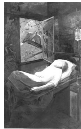
ایرج اسکندری ۱