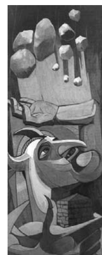
ایرج اسکندری ۵