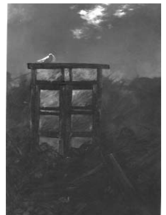
مصطفی گودرزی ۲