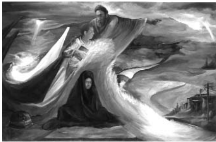
حمید قدیریان ۲