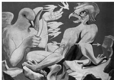
ایرج اسکندری ۳