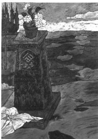
مصطفی گودرزی ۵