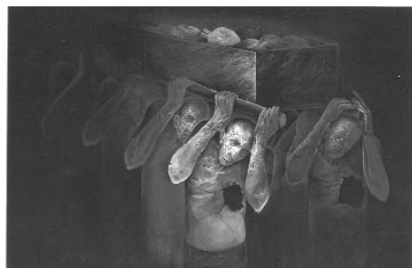
حبیب الله صادقی ۲