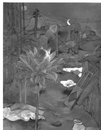
مصطفی گودرزی ۳