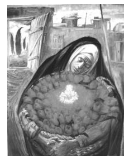
کازم چلیپا ۵