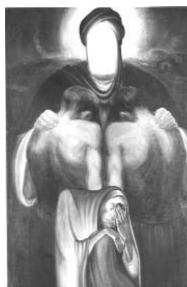
کازم چلیپا ۲