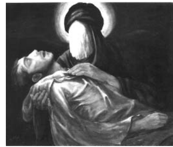
حمید قدیریان ۴