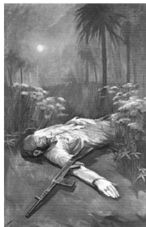
ایرج اسکندری ۲