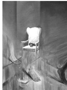
حبیب الله صادقی ۵