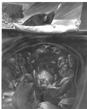
کازم چلیپا ۴