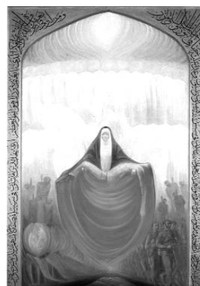
کازم چلیپا ۱