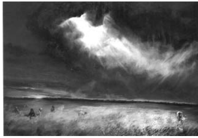
حمید قدیریان ۱