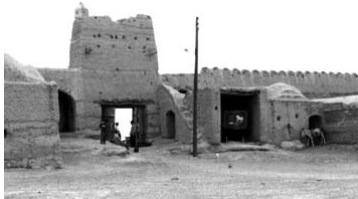
تصویر ۴- اصلاحات ارضی باعث خروج رعایا از قلعه های اربابی؛ تغییر مالکیت و بدنبال آن تغییر شکل بافت و مسکن شد.