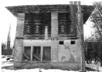
تصویر ۸- توجه به کاربرد ارزشهای پایدار دانش بومی ساخت و ساز در برنامه ها

این امر به طور مشخص در بازسازی مناطق سانحه دیده گیلان و زنجان ( زلزله خرداد ۶۹ ) و بازسازی واحدهای مسکونی روستایی شهرستان بم ( زلزله دی ۸۲ ) مشهود است (جدول ۵). از طرفی مشاهده اقدامات اجرایی در طول برنامه های اول تا چهارم نشان می دهد اصولاً این برنامه ها توجهی به تفاوت های عملکردی فضایی، جغرافیایی اقلیمی و سنت های سکونت و ارزش های معماری بومی نداشته اند، (تصاویر ۷ و ۸) و با همه تفاوت های موجود نیاز مسکونی آنها یکسان فرض شده و از طرفی گرایش برنامه ها بیشتر متوجه روستاهای بزرگ بوده است.