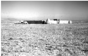
تصویر ۳- نمونه ای از قلعه های اربابی (گرمسار - استان سمنان)

به لحاظ عمیق شدن شکاف بین توسعه شهرها و روستاها و بحران هایی که گریبانگیر مناطق روستایی کشور شد، عمران روستایی برای اولین بار به شکل فصلی مستقل در برنامه مورد توجه قرار گرفت، هر چند در ارتباط با تامین مسکن هیچ اشاره ای در این برنامه صورت نگرفت. عملا اقداماتی که در این ارتباط در برنامه پیش بینی شده بود از آنچه در برنامه های قبلی وجود داشت فراتر نرفت.