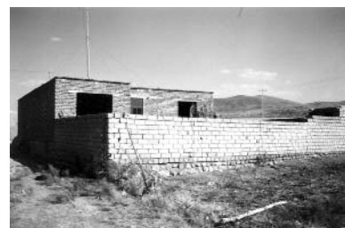
تصاویر ۵ و ۶- نمونه هایی از واحدهای مسکونی جدید که در روستاها احداث می شود (سمت راست روستای نلاس در آذربایجان شرقی - چپ، خوسف خراسان جنوبی)