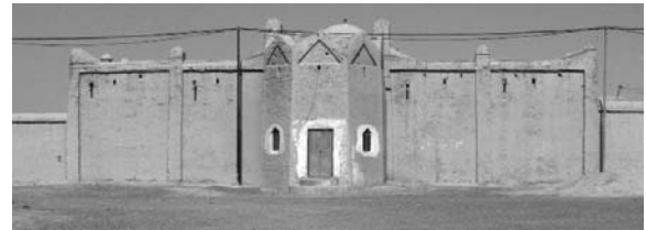
تصویر ۷- سابقه و قدمت اسکان در روستاها شکل گیری نوعی معماری با هویت بومی و محلی در مناطق مختلف کشور را دنبال داشته است

در زمینه استحکام واحدهای مسکونی، نسبت استفاده از مصالح بادوام در روستاها به یک میزان نبوده، و روستاهای بزرگ و پر جمعیت از شرایط بهتری برخوردار بوده اند، به طوریکه ۷۱ درصد از مجموع واحدهای مسکونی بادوام در روستاهای بالای ۵۰۰۰ نفر قرار دارند ۲۱ . این مسئله نشان دهنده عدم توزیع مناسب امکانات بین سکونتگاههای مختلف روستایی است. از طرفی به دلیل بلند پروازی های کمی برنامه ها و بی توجهی به ظرفیت و توان واقعی نظام ساخت و ساز و سرمایه گذاری، معمولاً بین آنچه پیش بینی می شود و آنچه در عمل اتفاق می افتد فاصله زیادی وجود دارد. میانگین تحقق برنامه دوم در ارتباط با تامین مسکن روستایی در مجموع فقط ۲۵ درصد رقم هدف، بوده و در زمینه بازسازی با هدف پیشگیری از اثرات سوانح (جدول ۳) بسیاری از موارد پیش بینی شده، تحقق پیدا نکرده است. عملکرد برنامه سوم در زمینه بهسازی و بازسازی مسکن نیز نشان دهنده تداوم مشکلات برنامه های اول و دوم بوده است. بررسی برنامه های نوسازی و بازسازی مسکن نشان می دهد تنها در مقاطع زمانی پس از