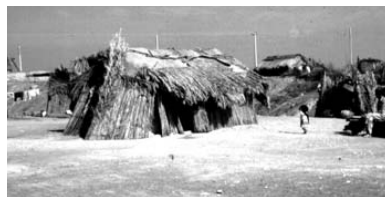
تصویر ۲- استفاده از ساخت مسکن با حداقل امکانات (سیستان و بلوچستان)