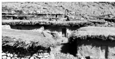
تصویر ۱- تکنولوژی ابتدایی مسکن بومی روستایی در مناطق عشایری بدلیل سابقه اسکان کم (استان کهگیلویه و بویر احمد)

شرایط نابسامان مناطق روستایی کشور در طول دهه های ۳۰-۲۰ شمسی و کمبودها و کاستی های موجود در این نقاط باعث شد تا دولت وقت به فکر تاسیس حوزه های عمرانی در مناطق روستایی برآید ۱ . در این برنامه که اولین برنامه توسعه کشور محسوب می شد مسکن روستایی مورد توجه ویژه قرار گرفت و به صراحت اعلام شد که یکی از مشکلات روستاها کیفیت نامناسب مسکن است. زوال و آسیب پذیری مسکن روستایی در آن زمان باعث شد تا توجه به ارتقاء کیفیت مسکن بعنوان یکی از نیازهای اساسی در اولین برنامه توسعه کشور مطرح گردد (تصاویر ۱ و ۲). مفاد این برنامه بر ایجاد تغییرات در مسکن و بهبود وضعیت آن و بهره مند شدن روستاها از خدمات آموزشی و بهداشتی و... اقدامات عاجل در این زمینه تاکید داشت. این برنامه که اولین برنامه توسعه در کشور محسوب می شد به خاطر وقایع ۱۳۳۰ و ۱۳۳۳ (روی کار آمدن دولت دکتر محمد مصدق، و جریانات مربوط به ملی شدن نفت، و کودتای امریکایی علیه دولت وی) و اتکاء بیش از حد به درآمدهای نفتی عملاً متوقف ماند و فرصت تحقق پیدا نکرد.