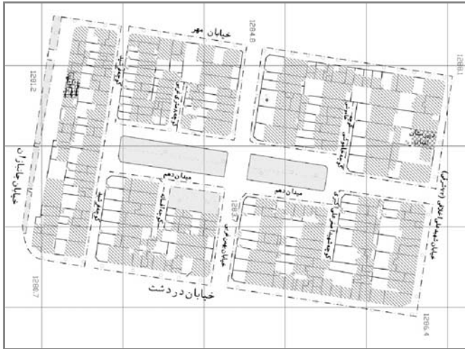
تصویر شماره ۳: میدان دهم (واحد همسایگی)