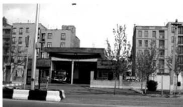
تصویر شماره ۱۱: آتش نشانی در محله نارمک

باشد. در مطالعه انجام شده، مکان گذران اوقات فراغت مورد سؤال قرار گرفت. براساس پاسخ‌های ساکنین، بیشترین مکان برای اوقات فراغت، منزل اعلام شده است (۳۹ درصد). پس از منزل، سایر مکان‌های گذران اوقات فراغت، به ترتیب میدان‌های داخلی نارمک (۳۲ درصد)، پارک‌های شهری (۱۵ درصد)، وضعیت و پارک‌های خارج از شهر (۱۲ درصد) بوده است (جدول ۹). داشتن ارتباط با همسایگان نیز مورد بررسی قرار گرفت. براساس پاسخ‌های داده شده، ۴۵ درصد دارای ارتباط روزانه با همسایگان بوده، ۳۳ ارتباط کم داشته و ۲۲ درصد بدون ارتباط با همسایگان اظهار شده است.