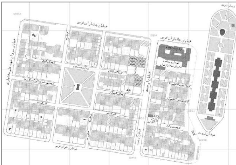
تصویر شماره ۵: میدان شصت و دوم (واحد همسایگی)