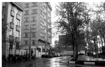
تصویر شماره ۱۳: افزایش تراکم (بلندمرتبه سازی در میدان داخلی محله)

ساعات پایانی شب برای اهالی و ذکر مکان های حادثه خیز از نظر ترافیک (امنیت ترافیکی) بود. براساس نظر پرسش شوندهگان، بیشترین نوع بزهکاری در محله مربوط به ولگردی و اراذل محله بود (۳۵ درصد). پس از بزهکاری، ۲۳ درصد اظهار نموده اند که بزهکاری قابل توجهی در محله وجود ندارد. بزهکاری های بعدی شامل ۲۲ درصد وجود اعتیاد و ۱۵ درصد وجود دزدی در محله اظهار گردیده است (جدول ۱۲). همچنین، ۶۴ درصد از پاسخ دهندگان اظهار کرده اند که امنیت کافی در ساعات پایانی شب وجود دارد (به جزء تعدادی که عدم امنیت برای بانوان را اظهار کرده اند). درخصوص آگاهی از ورود غریبه به محله، ۵۶ درصد نظر مثبت مبنی بر شناخت غریبه داشته اند (جدول شماره ۱۳). علاوه براین، در مورد شدت سرقت در محله، سؤال ویژه ای مطرح گردید که ۶۷ درصد جواب منفی، ۳۵ درصد نشان دهنده سرقت کم و ۸ درصد فقدان سرقت را مطرح کردند.