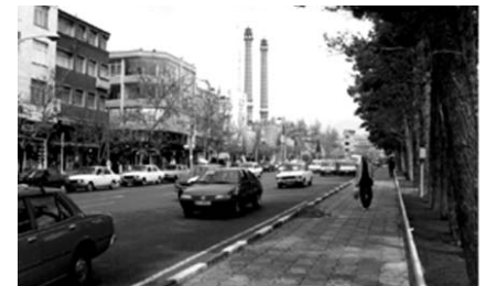
تصویر شماره ۶: میدان نوبت (هفت حوض) و مسجد النبی