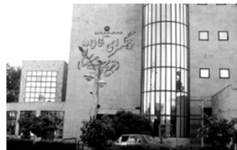
تصویر شماره ۹: فرهنگسرا در محله نارمک