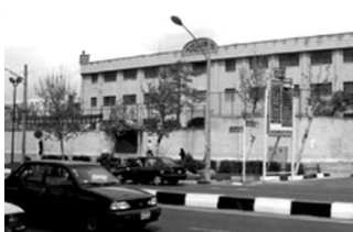
تصویر شماره ۱۰: دبیرستان در محله نارمک