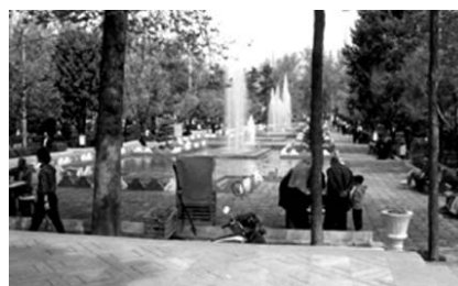
تصویر شماره ۷: میدان نوبت