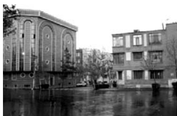
تصویر شماره ۱۲: تقابل ساخت و ساز قدیم و جدید (ورودی میدان داخلی محله)

در تأیید سؤال فوق الذکر، پاسخ های ساکنین به سؤال طرح شده برای سه مشکل اصلی محله نارمک نیز قابل تامل است. براساس جدول شماره ۱۶، بیشترین مشکل اظهار شده برای محله، شلوغی و ازدحام آن است (۴۵ درصد). پس از شلوغی و ازدحام، ترافیک و پارکینگ (۲۰ درصد)، کمبود فضاهای ورزشی و تفریحی (۱۵ درصد)، ولگردی و اراذل (۱۲ درصد)، مسئله جمع آوری زباله (۱۰ درصد) و ساخت و سازهای در حال انجام در محله (۸ درصد) بوده اند.