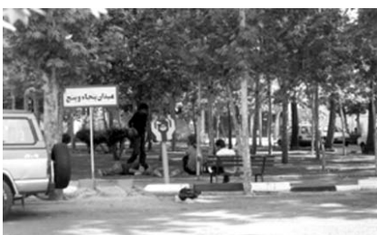
تصویر شماره ۸: نمونه‌ای از میدان‌های داخلی نارمک