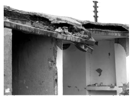
(تصویر شماره ۳)