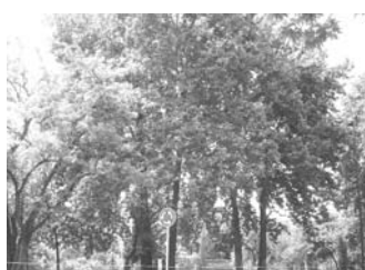
تصویر ۸- مناظر طبیعی میدان پیوسته با پارک.