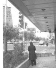
تصویر ۱- پیاده‌رو، راه.