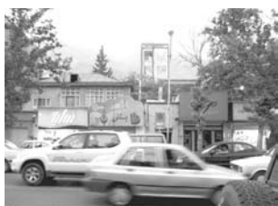
تصویر ۵- نمای ساختمانها و کوه در پیش زمینه.

عامل دیگری که هویت خیابان را تعریف می‌کند منظر بناهای واقع در آن یا "چشم‌های خیابان" است این موضوع هم به مدیران شهری و هم به درک جمعی مردم مربوط می‌شود. و توجه به اینکه سلیقه‌ی فردی بایستی در جهت یک نظم منطقی استوار باشد. علاوه بر اغتشاش ماشین‌ها بی نظمی تابلوهای مغازه‌ها، ساخت و ساز بدون در نظر گرفتن خط آسمان کوه‌ها که میراث و هویت این خیابان هستند و از بین بردن باغ‌های قدیمی و بی‌توجهی به ساختار قدیمی (هویت) این خیابان همگی باعث می‌شوند که از آن تنها به عنوان مسیر عبوری استفاده شود و