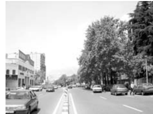
تصویر ۲- خیابان، راه و لبه‌ی سبز درختان.