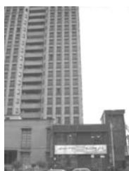
تصویر ۱۱- نمونه تیپولوژی.