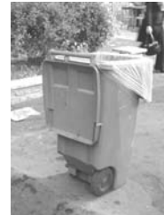
تصویر ۷- سطل زباله.