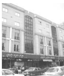
تصویر ۱۰- نمونه تیپولوژی.