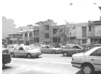
تصویر ۹- بدنه‌ی جنوبی نزدیک به میدان به سامان تر از نقاط دیگر هستند.