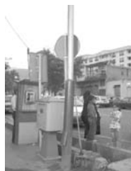
تصویر ۶- تداخل و نا به سامانی مبلمان.