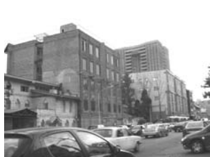
تصویر ۴- بدنه‌ی رها شده‌ی جنوبی خیابان.