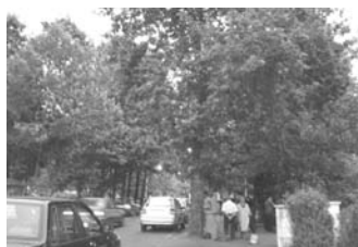
تصویر ۳- گره، میدان نیاوران.