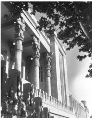
تصویر ۹- شهربانی تهران، اثر باغلیان رمانتیسیسم ملی ایرانی با بیان مستقیم.

چنین به نظر می‌رسد که در تداوم استفاده از فرم‌های