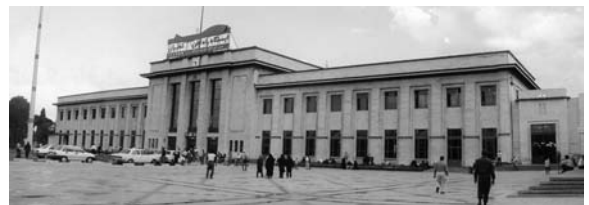
تصویر ۶- راه آهن تهران، اثر طاهر زاده بهزاد، رمانتیسیسم ملی اروپایی.