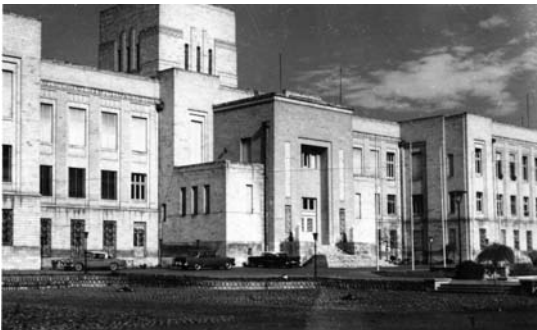
تصویر ۱۲- وزارت امور خارجه، اثر گورکیان، رمانتی سیسم ملی ایرانی با بیان غیر مستقیم.

در ادامه خط سیر پالایش و بیان غیر مستقیم در رمانتی سیسم ملی ایرانی به طور یقین کاخ و وزارت امور خارجه نمونه اوج پالایش یافتگی مذکور است. کاخ و وزارت امور خارجه بنایی یکپارچه سنگی با پلان و ساختاری متقارن است که از ترکیب احجام ساده هندسی شکل یافته است. در قسمت میانی بنا حجمی به شکل مکعب مستطیل و جلوآمده از بدنه اصلی، ورودی جنوبی