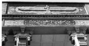
تصویر ۸- دبیرستان انوشیروان دادگر، اثر مارکف، رمانتیسیسم ملی ایرانی با بیان مستقیم.