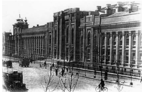
تصویر ۱۰- پستخانه، اثر مارکف، رمانتی سیسم ملی ایرانی با بیان غیر مستقیم.

بدین ترتیب تحت تأثیر گرایش‌هایی که به ساده کردن و استفاده از احجام و فرم‌های خالص تمایل داشتند، نوعی معماری پالایش یافته در چارچوب رمانتی سیسم ملی ایرانی پدید آمد که بیانی غیرمستقیم داشت. به تدریج و با کمی تقدم و تأخر گونه‌هایی از معماری در این دوران پدید آمد که اگر بخواهیم بر روی خط سیر تاریخی آنها خطی ترسیم نماییم، ساختمان پستخانه (تصویر ۱۰) به سال ۱۹۲۸ اثر مارکف در ابتدای راه، موزه ایران باستان (تصویر ۱۱) به سال ۱۹۳۵ اثر آندره گدار ۱۵ در اواسط راه و کاخ وزارت امور خارجه (تصویر ۱۲) به سال ۱۹۳۵-۳۸ اثر معمار شهیر ایرانی گابریل گورکیان ۱۶ ، در انتهای این سیر رمانتی سیسم ملی ایرانی با بیانی غیر مستقیم قرار دارد. هرچند که در میان این مسیر بناهای دیگری