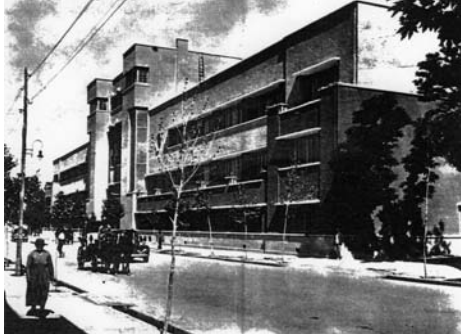
تصویر ۱۶- هنرستان دختران، اثر هوانسیان، پره-مدرن.

در سال ۱۹۲۵ وارتان هوانسیان اولین ساختمان تماماً مدرن در ایران را در یک مسابقه معماری برنده شد. ساختمان هنرستان دختران (تصویر ۱۶) این بنا را می‌توان اولین بنای راسیونالیستی ایران که بر مبنای اصول طراحی مدرنیسم شکل گرفته است، دانست (پاکدامن، ۱۳۶۲) بنای هنرستان دختران در ضلع شمال میدان مشق احداث شده است و هم‌اکنون نیز موجود است.