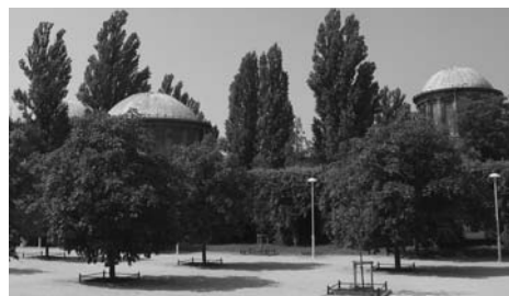
تصویر ۲ - پایون و روکلا، لهستان، اثر پولزیک، اکسپرسیونیسم فرمالیستی.