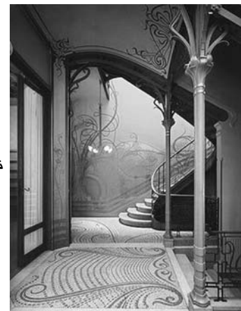
تصویر ۱ - هتل تاسل، اثر اورتا، آر-دکو.