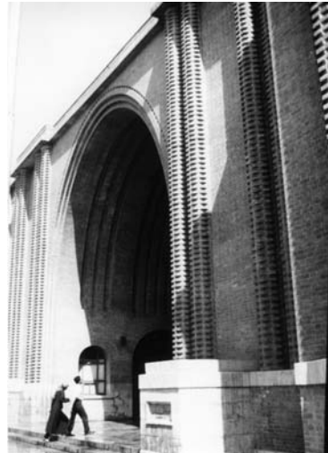
تصویر ۱۱- موزه ایران باستان، اثر گدار، رمانتی سیسم ملی ایرانی با بیان غیر مستقیم.