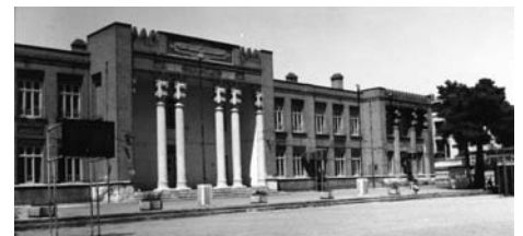
تصویر ۷- دبیرستان انوشیروان دادگر، اثر مارکف، رمانتیسیسم ملی ایرانی با بیان مستقیم.