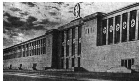
تصویر ۳ - قرارگاه هیتلر، زپلین فلد، اثر اشپیر، اکسپرسیونیسم آرمان‌گرا.