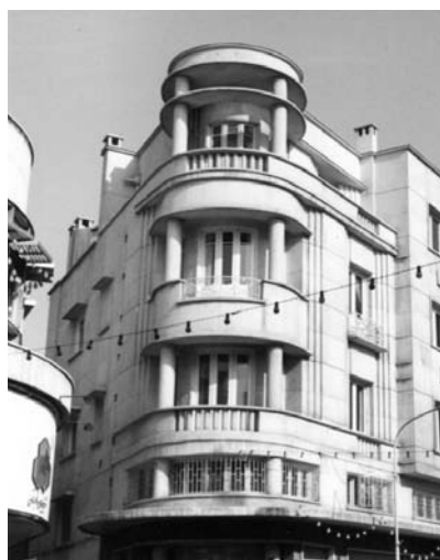
تصویر ۱۴ - شرکت آجیب، اثر هوانسیان، آر-دکو.