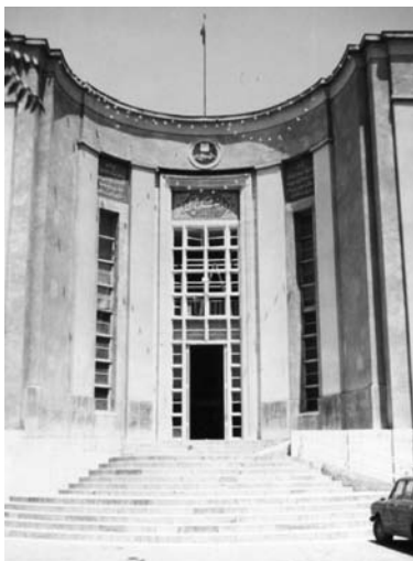
تصویر ۱۵ - دانشکده پزشکی - دانشگاه تهران، اثر گدار، نئوکلاسیسیزم خردگرا.

در دوره پهلوی اول رعایت اصول معماری نئوکلاسیک خردگرا در برخی بناهای دولتی و آموزشی شایع بود. در طراحی این ساختمان‌ها، ضمن رعایت برخی از اصول سبک نئوکلاسیک، از