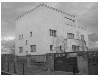
تصویر ۴ - ویلای مولر، پراگ، جمهوری چک، اثر آدلف لس پره-مدرن. (ماخذ: نگارنده)

شیوه دیگری که تحت تأثیر آر-نوو و عمدتاً در گرایش خرد ستیز در دهه ۱۹۱۰ بوجود آمد سبکی است که در نگاه اول، ظاهراً هیچ ارتباطی با این گرایش نداشته و از نظر فرم نیز کاملاً مستقل از آر-دکو به نظر می‌رسد. این سبک در تاریخ هنرهای تجسمی به سبک اکسپرسیونیسم شناخته می‌شود. در این شیوه معمار با به کارگیری و ترکیب احجام و عناصر، به نحوی بدیع به بیانی مجرد از ارزش‌های مستتر در آن می‌پردازد. به همین دلیل از لغت اکسپرسیونیسم و یا بیان‌گرایی برای نامیدن این شیوه استفاده شده است. اکسپرسیونیسم به دنبال "بیان" یک مطلب و یا مطالبی است که حاوی ارزش‌های مخفی در یک پدیده، اثر و یا جامعه باشد. بدین لحاظ اولین نکته‌ای که در رابطه با این شیوه به ذهن می‌رسد آنست که فرم، در آن نقشی اساسی و بنیادی را بازی می‌نماید. بدین لحاظ می‌توان اولین شیوه مستقل شده از اکسپرسیونیسم را اکسپرسیونیسم فرمالیستی نامید ۷ (تصویر ۲).