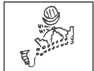
تصویر ۵- طرح تاج نوع اول اردشیر سوم. تصویر ۶- طرح تاج نوع دوم اردشیر سوم.