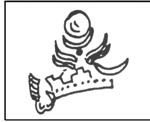
تصویر ۴- طرح تاج نوع دوم پیروز اول.

هرتسلفد نیز در تأیید نظریه خود مبنی بر اینکه شاه در تاق بستان همان خسرو پرویز است، به مشابَهت تاج شاه در تاق بستان و تاج منقوش بر سکه های خسرو پرویز استناد کرده و می نویسد: "از جمله شواهد مکتوب و ادبی که در همان روزگار تألیف شده تصویر شاه و تاج اوست که با تصویر تاج ضرب شده ی او بر سکه هایش مطابق است" (هرتسلفد، ۱۳۸۱، ۲۳۴). در رد نظریه هرتسلفد باید گفت، هر چند تاج شاه در تاق بستان شباهت های بسیاری با تاج خسرو پرویز دارد ولی خود آن نیست. شکی نیست که تاج برخی از پادشاهان ساسانی از جهات مختلف به یکدیگر شباهت دارند لیکن در اوج این شباهت ها دارای وجوه اختلافی نیز هستند که درک آنها مستلزم کمی دقت در مشاهده است. بی هیچ تردید، تاج نوع سوم خسرو پرویز (تصویر ۶) با تاج نوع دوم پیروز اول (تصویر ۴) از حیث شباهت، شبیه ترین تاج های پادشاهان ساسانی به یکدیگر