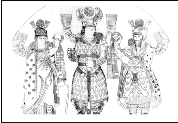
تصویر ۲- تاق بستان، طرح مجلس تاج ستانی، ماخذ: (Tanabe, 2003, 10)

پادشاه در وسط ایستاده و دست چپ خود را در جلوی شکم بر قبضه شمشیری که در میان پاهایش به صورت عمود قرار گرفته است نگه داشته و با دست راست حلقه سلطنتی را که نماد فره ایزدی و نشانه جانشینی خدا بر روی زمین است از اهورا مزدا که در سمت چپ شاه تصویر شده است می ستاند. در پشت شاه پیکره الهه آب آناهیتا نقش گردیده که او هم در حال اهدای حلقه سلطنتی به شاه است. بدن هر سه نفر به حالت ایستاده و به صورت تمام رخ نشان داده شده است. صورت پادشاه به علت ساییدگی و تخریب زیاد، چندان قابل توصیف نیست. او لباس بلندی بر تن دارد که تا زانو ها را می پوشاند. شلوار گشاد و چین داری بر پا و کمر بندی بر کمر دارد که بر روی آن و در قسمت جلوی شکم، شمشیری به طور حمایل با تسمه های چرمی آویخته شده است. پوشاک شاه اعم از لباس بلند، شلوار گشاد، غلاف شمشیر و حتی کمر بند چرمی آن مزین به رشته هایی از مروارید است که جلوه خاصی به آنها داده است. تزیینات شاه علاوه بر تزیینات جواهر گونه لباس، عبارت است از چند رشته مروارید غلطان که به صورت گردنبندی بر گردن شاه قرار گرفته و گوشواره هایی که آویزی از سنگ های قیمتی دارند (کریستین سن، ۱۳۶۷، ۳۷۸). تاجی که شاه بر سر دارد به شکل تاج بزرگ و کنگره داری است که دو رشته مروارید در زیر و هلالی در پیشانی دارد. بر فراز تاج، هلال بزرگتری است که در میان دو بال پرنده واقع شده و در میان هلال، گوی کوچکی رسم کرده اند (بیانی و رضوانی، ۱۳۴۹، ۶۵).