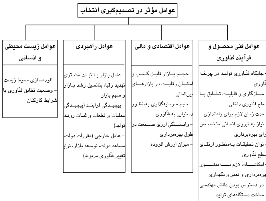
شکل ۲ عوامل مؤثر در تصمیم‌گیری انتخاب

با توجه به اهداف و راهبرد کلان صنعت پارافین، می‌توان عوامل مؤثر بر این ابعاد را در شکل ۲ به عوامل جزئی‌تر تقسیم کرد. با شناسایی این عوامل می‌توان آثار انتخاب هر گزینه را مورد تجزیه و تحلیل قرار داده، تحت مدلی به اتخاذ تصمیم پرداخت.