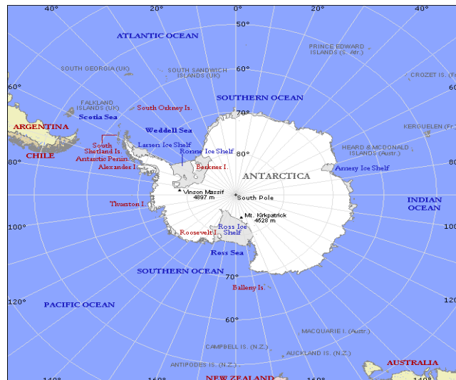
شکل ۱ موقعیت جغرافیایی قطب جنوب [۱]

جنوبگان (قطب جنوب) قاره‌ای پهناور و یخی است که مساحت کل آن با احتساب جزایر و فلاتهای یخی در حدود ۱۴ میلیون کیلومتر مربع می‌باشد [۱، ۲] (شکل ۱).