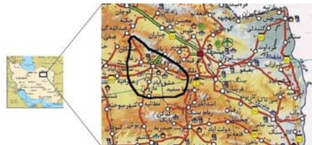
شکل ۱ موقعیت دشت مورد مطالعه

مورد توجه قرار گرفته است. در همین زمینه Yang و همکاران در رودخانه زرد چین مطالعاتی انجام دادند، به این نتیجه رسیدند که شرایط آبیاری در چین تحت تأثیر مستقیم بارش و میزان تبخیر قرار داشته و در دهه‌هایی که بارش بیشتر و میزان تبخیر کمتر بوده امکان آبیاری بهتری فراهم بوده است [۵]. فرت ۱ و وارد ۲ نیز به بررسی اثر برنامه‌ریزی کاربری اراضی کشاورزی بر کیفیت آب زیرزمینی پرداختند. آنها در این بررسی به نقش سموم حاصل از فعالیتهای کشاورزی در آلوده ساختن آبهای زیرزمینی پرداختند و ضرورت سیاستگذاریهای مناسب را برای جلوگیری از این امر توصیه کردند [۶]. در دشت نیشابور نیز مسأله بحران آب، در نتیجه به هم خوردن تعادل هیدرولوژیکی و افزایش تقاضا از منابع آبی از سال ۱۳۶۵ به بعد نمود پیدا کرده است و چنانچه بهره‌برداری به صورت بی‌رویه از منابع آب و الگوی بیلان منفی از منابع موجود، متوقف نشود به تدریج حجم آب شیرین و قابل‌استفاده کاهش خواهد یافت و مسأله بحران آب، منجر به تهی شدن کامل مخازن آب زیرزمینی دشت شده، تمام سرمایه‌گذاریهای انجام شده از بین خواهد رفت. دشت نیشابور، جزئی از حوضه آبریز کال‌شور نیشابور است که در شمال شرق کویر مرکزی واقع شده است. شکل ۱ نشان‌دهنده موقعیت منطقه مورد مطالعه است.