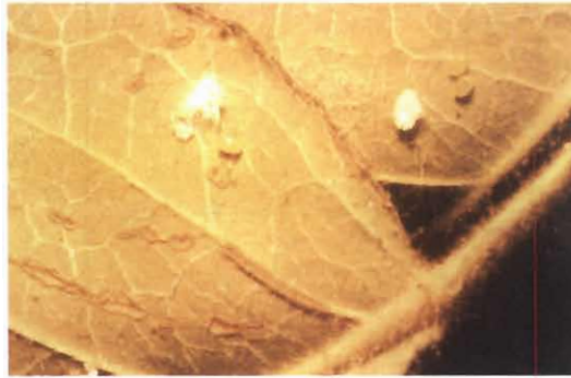
شکل ۲- دسته تخم E. rhododactylus