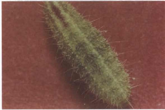
شکل ۳- لارو سن دوم E. rhododactylus Fig. 3- 2 nd Instar larva of E. rhododactylus