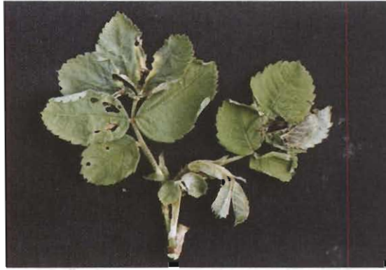
شکل ۵- آثار تغذیه لارو E. rhododactylus از برگ‌های درون جوانه برگ