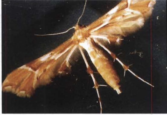
شکل ۱- حشره کامل E. rhododactylus