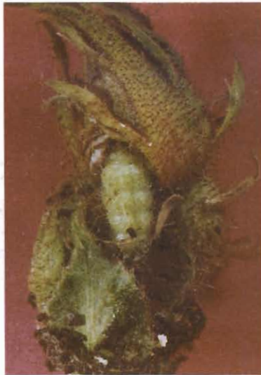
شکل ۶- نحوه تغذیه لارو E. rhododactylus از غنچه