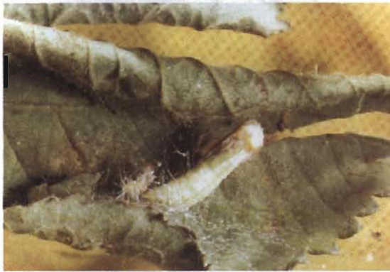
شکل ۴- شفیره E. rhododactylus Fig. 4- Pupa of E. rhododactylus