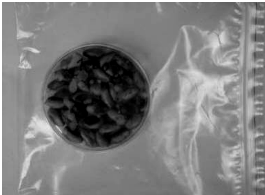
شکل شماره ۲- طرح بسته‌بندی جهت بررسی اثرات ضدقارچی عصاره آویشن شیرازی در مغز پسته سترون پوشش دیده با پوشش‌های حاوی عصاره در دمای ۲۵ درجه سانتی‌گراد و رطوبت نسبی ۷۵ درصد

الکلی گیاهان آویشن شیرازی به خوبی باعث مهار رشد قارچ آسپرژیلوس فلاووس در محیط کشت شدند. جدول شماره ۲ میزان گسترش عصاره از دیسک به محیط کشت حاوی آسپرژیلوس فلاووس را براساس میلی‌متر بر روی مغز پسته‌ها نشان می‌دهد. در پسته‌هایی که به عنوان گروه کنترل هیچ گونه تیماری (عدم پوشش‌دهی و عدم وجود عصاره) بر روی آن‌ها اعمال نشده است، میسلای قارچ آسپرژیلوس فلاووس پس از ۲ روز تمام سطح پلیت‌های حاوی مغز پسته را پوشاند. در گروه پوشش دیده (بدون عصاره) نیز میسلای قارچ به طور کامل سطح پلیت را فراگرفت. در گروه‌های پوشش دیده با مقادیر ۱۰۰، ۵۰۰ و ۱۰۰۰ ppm عصاره نیز تا پایان روز سوم محدودیت رشد (جدول شماره ۲) را شاهد بودیم. در مقادیر ۱۵۰۰ و ۲۰۰۰ ppm به ترتیب تا پایان روز چهارم و ششم این محدودیت رشد مشاهده شد. در مقدار ۲۵۰۰ ppm هیچ‌گونه رشدی با ۳ تکرار مشاهده نشد.