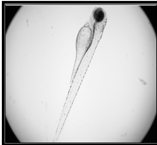
شکل شماره ۳- لارو ماهی زبرا پرورش یافته در مرکز تحقیقات زیست فناوری دانشگاه علوم پزشکی تهران

خارج از رحم صورت می‌گیرد) و به این ترتیب امکان ردگیری اثرات مختلف ترکیبات مورد آزمایش امکان‌پذیر خواهد شد. نکته کلیدی دیگر در بررسی مولکول‌های فعال با استفاده از لارو و جنین این ماهی، امکان افزودن ترکیبات به صورت غیراستریل به محیط رشد آن‌ها است که سرعت انجام روندهای غربالگری را افزایش می‌دهد [۴].