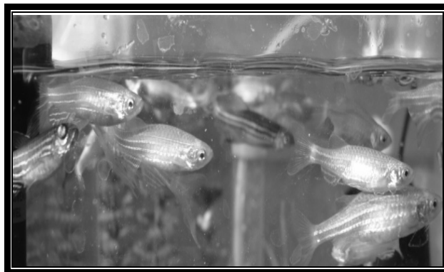
شکل شماره ۱- ماهی زبرا بالغ پرورش یافته در مرکز تحقیقات زیست فناوری دانشگاه علوم پزشکی تهران

جدول شماره ۱- طبقه‌بندی علمی ماهی Danio rerio (1).