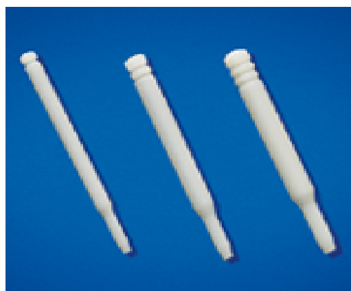
شکل ۲- نمونه‌ای از پست 2- Staged design

پست‌های موازی گیر بیشتری نسبت به پست‌های مخروطی ایجاد می‌کنند. رابطه گیر با فرم سطحی پست‌ها به ترتیب کم شدن گیر از این قرار است: Smooth, Serrated, Threaded (۲۲). براساس گزارش‌های ارائه شده توزیع تنش پست‌های موازی به دیواره کانال در مقایسه با پست‌های مخروطی یکنواخت‌تر است (۲۳). هر چند که در کل در پست‌های موازی تمرکز تنش بیشتر در ناحیه اپیکال و در پست‌های مخروطی در قسمت کروئالی فضای پست می‌باشد (۲۲). در مطالعه دیگری عنوان شد که بیشترین تنش توسط پست‌های Tapered self threaded و کمترین تنش توسط پست‌های غیرفعال مخروطی که در حقیقت Self-Venting هستند، ایجاد می‌گردد. به هر حال پست‌های مخروطی، چه فعال و چه غیرفعال، موجب وج شدن و در نتیجه احتمال بیشتر شکستن ریشه می‌شوند (۲۵-۱۸،۲۳). در کل از نظر ایجاد گیر و استرس، اغلب موارد بهترین و ایمن‌ترین پست‌ها، پست‌های Parallel serrated با Venting هستند (۱۸،۲۳،۲۵).