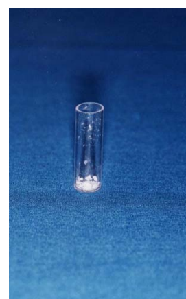
شکل ۴- ویال حاوی دبری پس از آماده‌سازی کانال

تعیین رابطه بین میانگین وزن دبری با طول وزاویه انحنای ریشه، استفاده شد. P < 0.05 معنی‌دار تلقی شد.