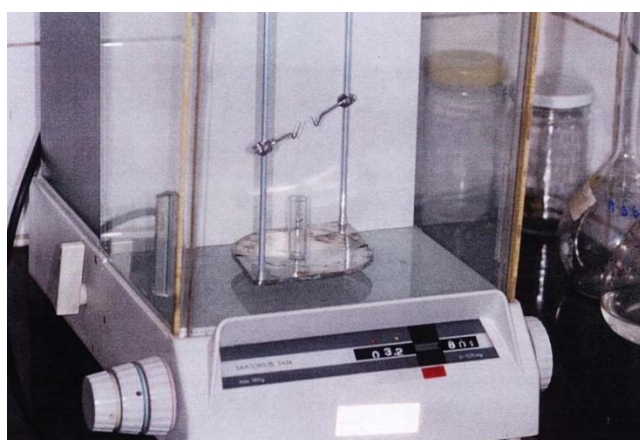
شکل ۵- توزین ویالها بر روی ترازو