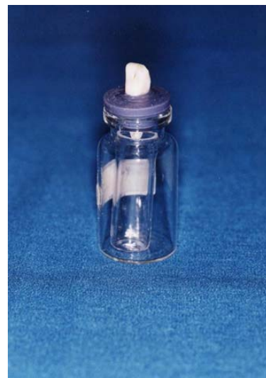
شکل ۱- ویال شیشه‌ای استفاده شده

از بستن در ویال، یک دندان داخل سوراخ ویال قرار گرفته و سپس در ویال، با چسب سیانوآکریلات سیل شد. بدین ترتیب مدلی ساخته شد که تا حد قابل قبولی به محیط دندان شباهت داشت. جهت یکسان کردن فشار هوا در داخل و خارج ویال، با یک سرسوزن ۷ گیج، در ویال‌ها، سوراخ ایجاد شد (شکل ۱). هر ویال شیشه‌ای شسته شده در oven خشک شدند و دو بار توسط ترازوی startorius (Switzerland, Brand, Ohaus) و با دقت ۵-۱۰ میلی‌گرم) توزین گردید. پس از آن کلیه فلاسک‌ها بر روی یک گیره منتقل شده تا در وضعیتی ثابت و یکسان قرار گیرند (شکل ۲). برای جلوگیری از مداخله عمل‌کننده و دید چشمی، رابردم مورد استفاده قرار گرفت (شکل ۳). تمام وسایل مورد استفاده در این مطالعه، از جنس شیشه انتخاب شدند تا حداقل براده را به جا گذارند. به علاوه اشیایی که باید وزن می‌شدند، با دست جابجا نشدند تا دبری‌های روی دست، بقایای اپیتلیوم و یا پودر تالک دستکش باعث اضافه وزن نمونه‌های مورد آزمایش نگردند.