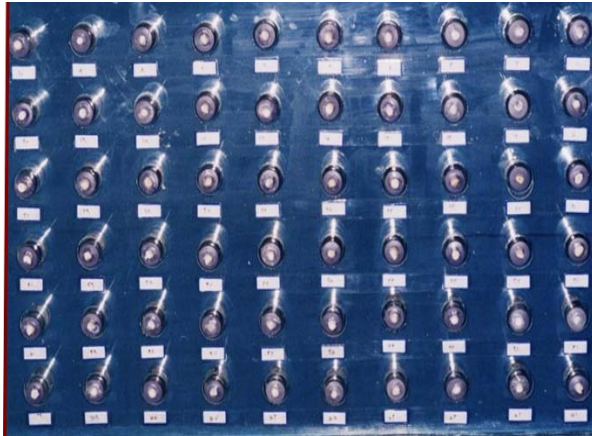
شکل ۲- نگهداری ویال‌ها

بزرگتر از فایل اولیه (MAF=۳۵) به روش step back صورت گرفت. ناحیه کرونا نیز، با فرزهای شماره ۲، ۳ و ۴ (gates-gliden (000824000400, Tulsa, Oklahoma, USA), refine شد. عمل flaring، تا سایز ۵۵ و ۶۰ ادامه یافت.