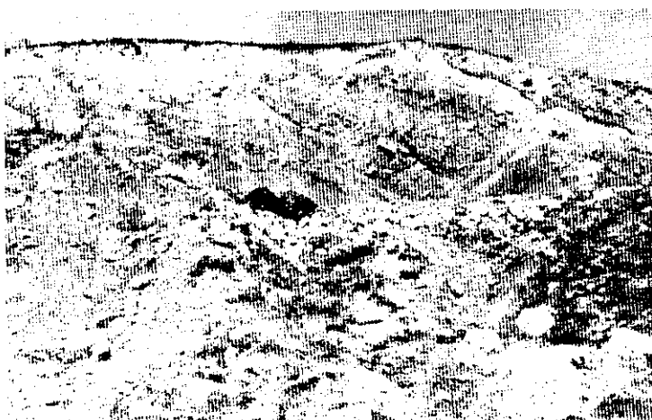
شکل ۵ نشان‌دهنده ضخامت توده خاک در محل زمین لغزش نامانلو