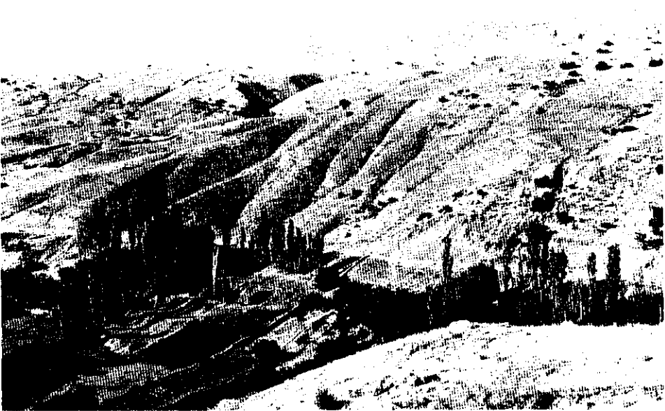
شکل ۶ مورفولوژی دامنه‌ها و آثار زمین‌لغزش‌های قدیمی در منطقه مورد مطالعه

سازند سرچشمه از مارن‌ها و شیل‌های واجد تداخل‌های نازک آهکی تشکیل یافته است. بخش مارنی این سازند از جمله واحدهای سنگی محسوب می‌شود که زمین لغزش‌های زیادی را سبب شده است. سازند تیرگان عامل ایجاد ارتفاعات مشرف به روستای نامانلو و سازند سرچشمه دامنه‌های این ارتفاعات را تشکیل می‌دهد که از شیب قابل توجهی برخوردار است. روی سازند سرچشمه را مواد آواری عهد حاضر می‌پوشانند که دارای جورشدگی بسیار ضعیفی هستند. اندازه قطعات آواری از حد سیلت تا تخته سنگ‌های به قطر حدود یک متر را شامل می‌شود. ضخامت مواد آواری متغیر است و به تبعیت از مورفولوژی سازند سرچشمه حداکثر به حدود ۱۵ متر می‌رسد (شکل ۵).