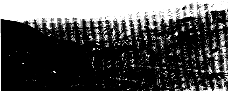
شکل ۲ روستای نامانلو که بر روی تشکیلات سرچشمه قرار دارد

استان خراسان با وسعتی معادل ۳۱۳۰۰۰ کیلومتر مربع در شمال شرق ایران قرار گرفته و ناحیه مورد مطالعه در شمال این استان واقع است. آب و هوای استان به علت تداخل آب و هوایی مختلف که از جبهه‌های غرب، شمال غرب و شمال شرق وارد می‌شوند متغیر و متنوع است. متوسط بارندگی سالانه در استان ۱۸۰ تا ۲۰۰ میلی‌متر گزارش شده است [ولایتی، ۱۳۶۶]. به طور کلی می‌توان استان خراسان را جزء مناطق خشک و نیمه خشک محسوب نمود. متوسط بارندگی سالانه در نواحی شمال غرب خراسان به ویژه منطقه شهرستان شیروان که در زون اقلیمی نیمه کوهستانی قرار دارد حدود ۳۰۰ میلی‌متر است [کمالی، ۱۳۶۶]. ذوب برف‌ها که ممکن است تا اواسط تابستان ادامه داشته باشد موجب می‌شود که تقریباً اغلب رودخانه‌های منطقه دارای رواناب سطحی باشند. به علاوه چشمه‌های متعددی در منطقه جاری است که اغلب آب مصرفی روستاییان را تأمین می‌نماید.