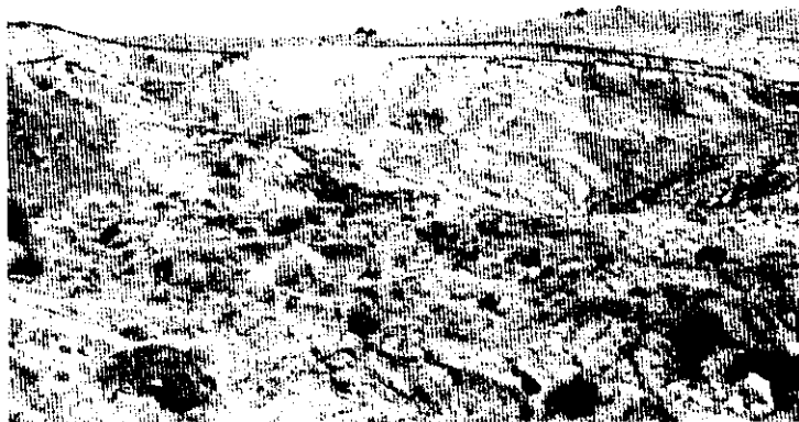
شکل ۴ زمین لغزش نامانلو در بالادست روستا

زمین لغزش نامانلو در شرق روستای نامانلو به وقوع پیوسته است (شکل ۴). واحدهای سنگی این ناحیه را سازندهای تیرگان و سرچشمه تشکیل می‌دهند که از نظر سنی متعلق به کرتاسه پیشین می‌باشند [افشارحرب، ۱۳۷۳ و Afshar-Harb, 1979].