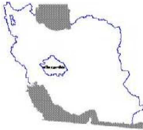
شکل ۱. منطقه مورد بررسی در ایران مرکزی