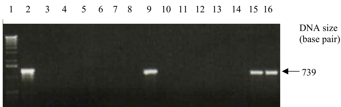
شکل ۵. نتایج آزمون PCR برای ریشه‌های مویین تراریخته BinOF2 برای تشخیص ژن GUS