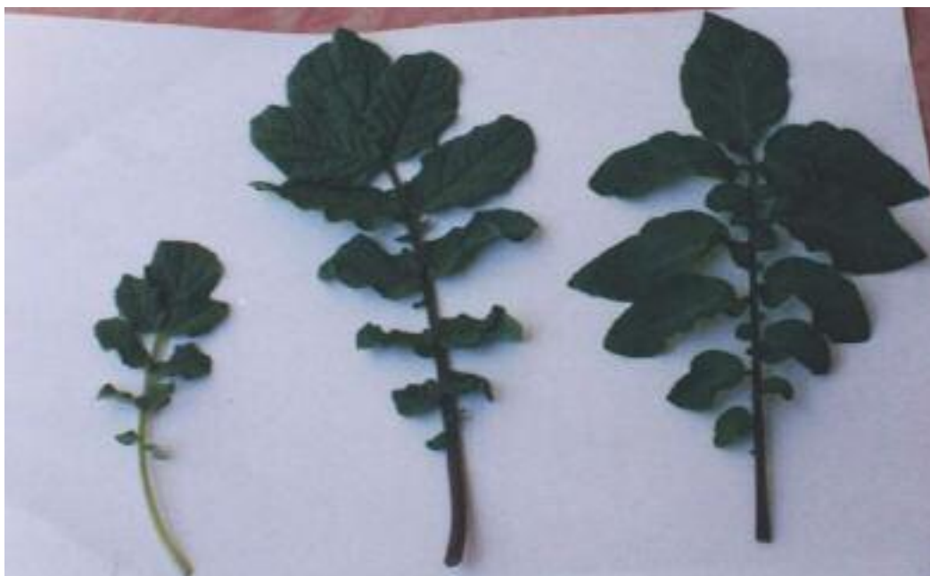
شکل ۱. شکل برگ‌ها در والدین و هیبرید به ترتیب از راست به چپ: فوراً، هیبرید فوراً \times آکول و آکول