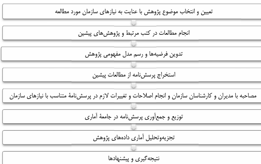
شکل ۲. مراحل انجام پژوهش

تعیین میزان پایایی پرسش‌نامه، از ضریب آلفای کرونباخ استفاده شد که مقدار آن ۰/۹۰۴ به دست آمد و با توجه به اینکه مقدار به دست آمده بیشتر از ۰/۷۰ است، در نتیجه پایایی پرسش‌نامه نیز تأیید می‌شود. از تعداد ۱۰۵ پرسش‌نامه توزیع شده میان متخصصان و کارشناسان منطقه ۳ عملیات انتقال گاز ایران که در حوزه کاری مرتبط با پروژه‌ها فعالیت می‌کنند، تعداد ۸۰ پرسش‌نامه (۷۶ درصد) جمع‌آوری شد. خلاصه‌ای از مراحل انجام پژوهش در شکل ۲ نشان داده شده است.