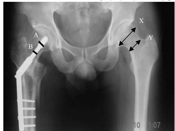
شکل ۲- نحوه اندازه‌گیری معیارهای X-Y-A-B

میانگین سنی در ۱۲۸ بیمار مورد مطالعه ۷۴/۴ سال و حداقل سن ۷۰ سال و حداکثر آن ۸۰ سال بوده است. در این مطالعه ۸۶ بیمار (۶۷٪) زن و ۴۲ بیمار (۳۳٪) مرد بوده‌اند.