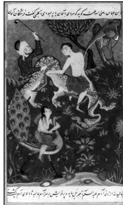
تصویر ۱: صحنه‌ای از داستان آدم و حوا در یک نسخه خطی کهن.