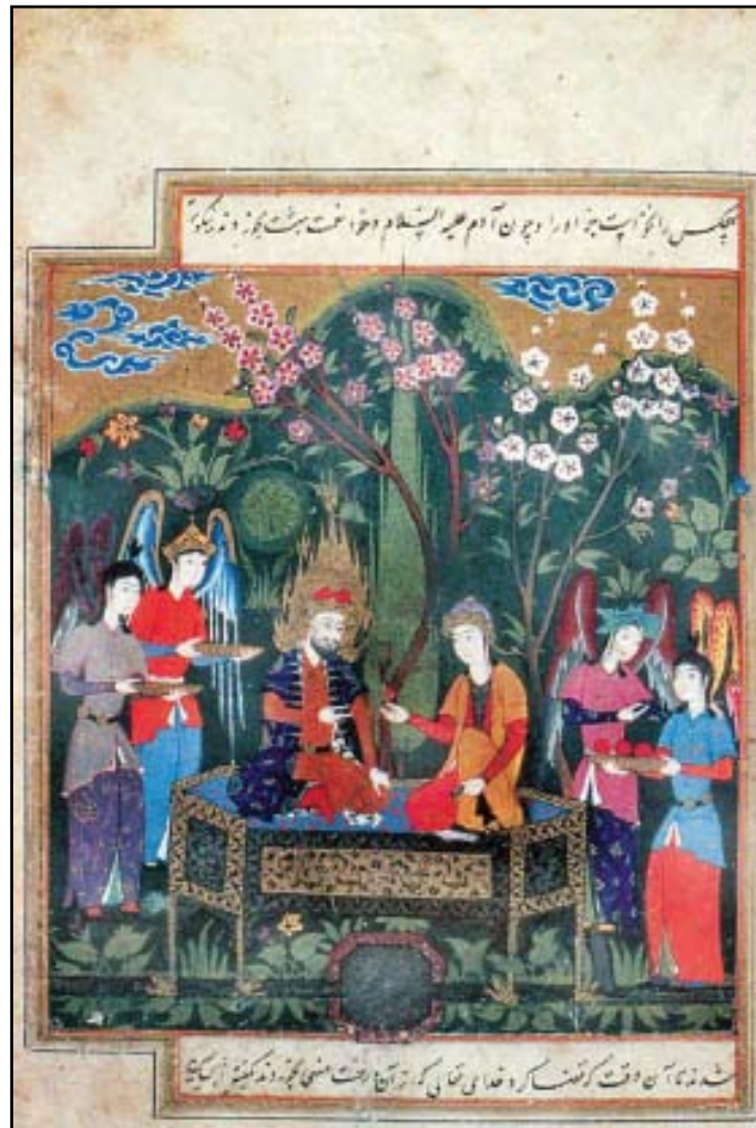
é " "