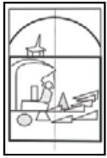
fiL : é " "