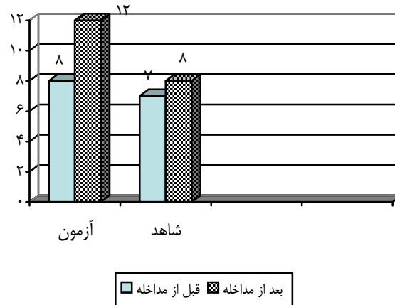
نمودار شماره ۲: مقایسه میانگین نمرات کیفیت زندگی در اجزاء بعد فیزیکی در گروه آزمون و شاهد قبل و بعد از مداخله