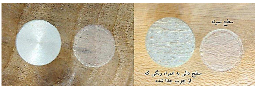
شکل ۲: نمایی از نمونه تست شده مقاومت چسبندگی گونه چنار در سمت راست و گردو در سمت چپ