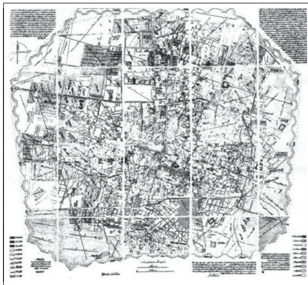
شکل ۲. نقشه تهران ناصری

در کنار عوامل بیرونی پیرامون رشد شهر و تغییرات کالبدی تهران می‌توان به عواملی همچون افزایش جمعیت تهران و احداث قصرهای سلطنتی، کوشک‌های اعیانی و سفارتخانه‌ها و منازل خارجی‌ان در بیرون حصار و رشد محله‌های جدید پیرامون بارو نیز اشاره نمود (سعیدنیا،