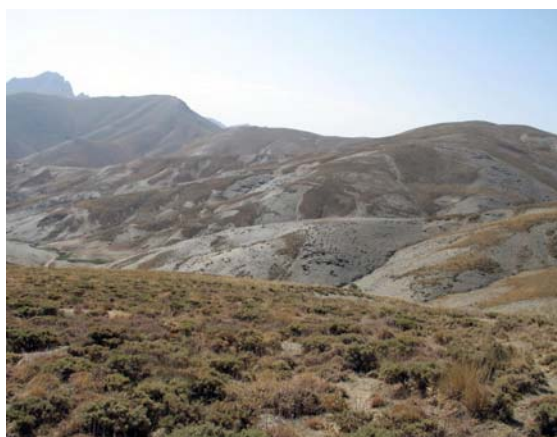
شکل ۳: نمایی از منطقه و رویشگاه گون سفید

پوشیده از کرک ها و تارهای پنبه ای سفید شده و گیاه دارای پوششی پنبه مانند خواهد شد (۱۴ و ۱۹) (شکل ۲). گون سفید بر اساس فرم بیولوژیک و گروه بندی رانکایر ( Raunkiaer ) جزء کاموفیت ها ( Chamephytes ) محسوب می شود (۴). با توجه به گستردگی تاج پوشش و سیستم ریشه ای عامل مهمی در ممانعت از فرسایش و جابجایی خاک رویشگاه خود محسوب می شود (شکل ۳). پوشاننده بخش عظیمی از مناطق جهان (کشورهای سوریه، لبنان، ترکیه، عراق و ایران) می باشد و بیشتر