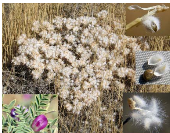
شکل ۲: گل، بذر و بوته گون سفید

سه کلاس شیب مشخص شد. در هر یک از سطوح عوامل فوق منطقه معرف شناسایی و اندازه گیری ها در درون آن انجام شد. با پیمایش صحرایی فهرست برداری فلور منطقه انجام شد و با کمک منابع کتابخانه ای (۶، ۱۳، ۱۴، ۱۶، ۲۶، ۲۹) و بررسی های آزمایشگاهی و هرباریومی شناسایی و تأیید شدند، اجتماعات و تیپ های گیاهی نیز به روش فیزیونومیک-فلورستیک مشخص شدند (۷ و ۸). در هر