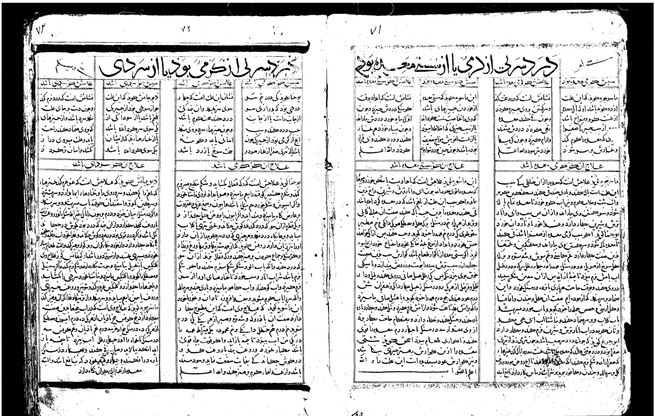
تصویر شماره ۱ - نمونه‌ی معرفی بیماری‌ها در کفایه الطب

مجسه (نبض‌شناسی)، علایم بیماری و بهبودی، دانستن حال و هوای شهرها و گردش چهار فصل بیان شده است. متن اصلی کتاب اول که در مورد شناخت بیماری‌هاست در داخل جداولی ارائه شده است که سه بخش دارند: سبب، علامت و علاج بیماری. هر صفحه از کتاب شامل دو جدول است که معمولاً هر دو درباره‌ی یک بیماری توضیح داده است. در بیشتر موارد تفاوت این دو جدول مربوط به عامل بیماری است که یا از گرمی است یا سردی. برای مثال، تب مطبق که از سردی باشد یا از گرمی. گاه تفاوت این دو جدول مربوط به تفاوت دیدگاه دو طبیب در مورد یک بیماری است و گاه