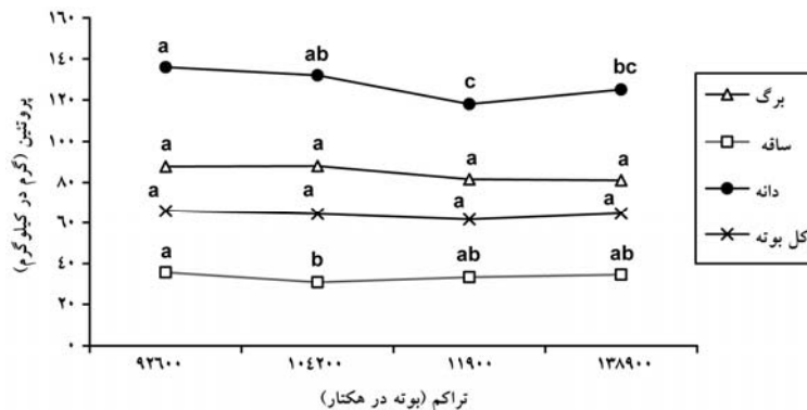
شکل ۲- تأثیر تراکم بوته بر پروتئین اندام‌های مختلف ذرت سیلویی.

مقدار نیتروژن مصرفی بر محتوای پروتئین خام دانه ذرت تأثیر معنی‌داری داشت (جدول ۴). واکنش پروتئین خام دانه به مصرف کود نیتروژن به صورت مستقیم بود و حداکثر مقدار آن با تیمار ۳۲۰ کیلوگرم نیتروژن در هکتار به دست آمد (شکل ۱). به طور کلی با افزایش هر کیلوگرم نیتروژن غلظت پروتئین دانه حدود ۰/۲۵ گرم در کیلوگرم ماده خشک افزایش یافت. این میزان افزایش حدود ۰/۰۷ گرم در کیلوگرم بالاتر از گزارش دیگر محققان بود (مامان و همکاران، ۱۹۹۹؛ بابنیک و همکاران، ۲۰۰۲). به نظر می‌رسد اختلاف مذکور به علت به کارگیری سطوح بالاتر نیتروژن و برداشت زودتر محصول در آزمایش حاضر بود (کوکس و چرنی، ۲۰۰۲؛ کوکس و چرنی، ۲۰۰۵). در تیمار ۳۲۰ کیلوگرم نیتروژن در هکتار نیاز گیاه به این عنصر تأمین شده و ظاهراً مازاد آن در بافت گیاه تجمع یافته است. بنابراین تجمع بیشتر نیتروژن می‌تواند عامل پروتئین بالای این تیمار باشد. در مطالعه کوکس و چرنی (۲۰۰۳) نیز در اثر افزایش مصرف نیتروژن پروتئین دانه ذرت افزایش یافت.