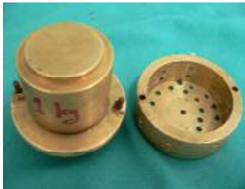
شکل ۲. مدل آزمایشگاهی ساخته شده

وسایل آزمون ده ساعت قبل از کار در شرایط لابراتواری در دمای ۲۳-۲۱ درجه سانتی‌گراد و رطوبت ۳۰ تا ۴۰ درصد قرار داده شد. برای ساخت نمونه‌ها ابتدا پودر هیدروکلوتید غیر قابل برگشت طبق توصیه کارخانه سازنده به میزان ۱۴ گرم پودر با ترازوی دیجیتالی با دقت یک هزارم گرم اندازه‌گیری شد و با ۲۵ میلی‌لیتر آب مقطر ۲۳ درجه سانتی‌گراد (توسط دماسنج جیوه‌ای اندازه‌گیری شد) مخلوط گردید. توسط کرنومتر دیجیتالی، زمان اختلاط برای هر سه ماده، طبق دستورالعمل کارخانه سازنده ۴۵ ثانیه در نظر گرفته شد. خمیر در داخل تری مخصوص از پیش آماده شده قرار گرفت و قالب‌گیری از مدل انجام و تحت فشار یک کیلوگرم قرار داده شد. پس از طی زمان سخت شدن، بنا بر توصیه کارخانه سازنده بلافاصله مجموعه قالب‌گیری شده در حمام آب گرم 32 \pm 1 درجه سانتی‌گراد به مدت ۳ دقیقه قرار گرفت. سپس مجموعه از حمام آب گرم خارج و تری با حداقل استرس از مدل جدا و بلافاصله ریخته شد. برای ریختن قالب از گچ استون (Type III)، به نسبت ۱۰۰ گرم پودر به ۳۰ میلی‌لیتر آب مطابق توصیه کارخانه سازنده و روش اختلاط استاندارد (با استفاده از ویراتور) استفاده شد. برای هر ماده ۲۰ بار مراحل تکرار و در مجموع ۶۰ مدل گچی به دست آمد.