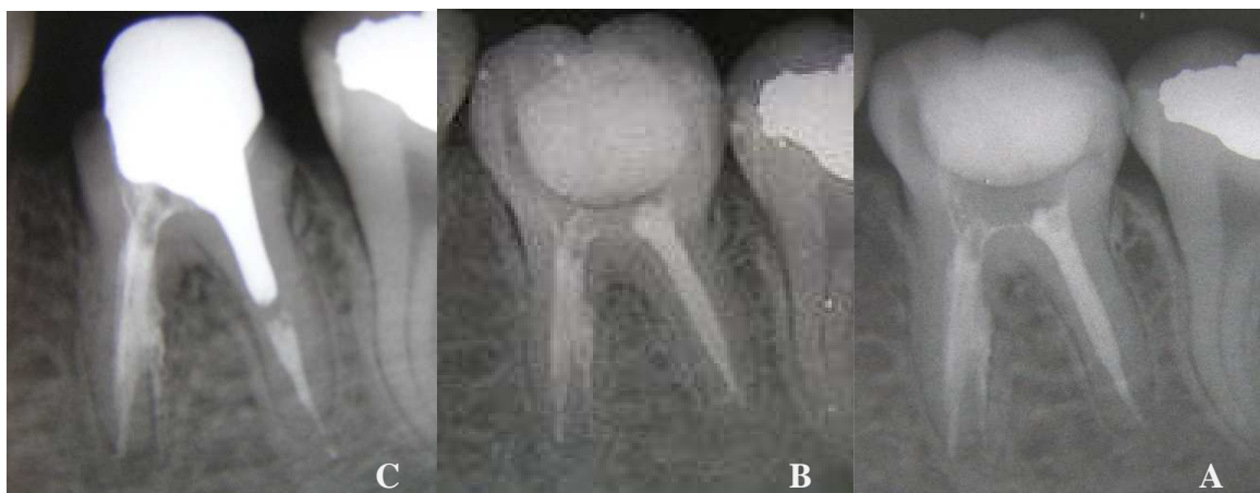
شکل ۲. موفقیت بستن پر فوریشن با MTA

C- نمای رادیوگرافی ناحیه پر فوریشن ۳ ماه بعد از ترمیم، D- نمای رادیوگرافی ناحیه پر فوریشن ۶ ماه بعد از ترمیم