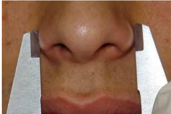
تصویر ۱. اندازه‌گیری فاصله بین پره‌های بینی (۱)

این پژوهش مشاهده‌ای و مقطعی در پاییز سال ۱۳۸۷ در دانشکده دندان‌پزشکی اصفهان انجام گرفت و نمونه‌ها از بین دانشجویان این دانشکده انتخاب شدند. روش نمونه‌گیری به صورت آزاد بود و حدود ۱۲۰ داوطلب شامل ۶۰ مرد و ۶۰ زن، با دامنه سنی ۱۸-۲۸ سال که همگی معیارهای ورود به پژوهش را دارا بودند، در این پژوهش شرکت داده شدند. معیارهای ورود به پژوهش شامل موارد زیر بود: دارای ملیت ایرانی، دارای سن ۱۸ سال یا بیشتر (تا از نظر رشد اسکلتال و بافت نرم کامل شده باشند)، دارای بینی طبیعی بدون هیچ بد شکلی، دارای شش دندان قدامی سالم بدون شکستگی، روکش یا ترمیم در فک بالا، بدون سابقه جراحی زیبایی بینی و بدون سابقه درمان ارتودنسی. در ضمن داوطلبان باید از نظر اکلوژن کلاس I بوده، در قوس دندانی هیچ درهم ریختگی یا فضایی نداشته، کلیه دندان‌ها در قوس دندانی هم‌ردیف و روی Line of Occlusion می‌بود و قوس متقارنی را تشکیل می‌داد [۲۱، ۱۶، ۱۳].