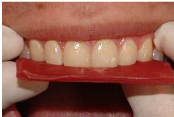
تصویر ۲. گرفتن شاخص مومی از لبه انسیزالی دندان‌های قدامی ماگزایلا (۱)