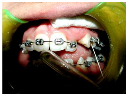
شکل ۱: نمونه‌گیری از مایع شیار لثه‌ای با کمک کن کاغذی در شرایط جداسازی با رل پنبه

دندان‌های بیمار و عدم وجود خونریزی به هنگام پروب کردن. ۵- عدم حضور شواهد رادیوگرافی تحلیل استخوان پریودنتال. اولین نمونه گیری بعد از نصب وسایل ارتودنسی ثابت و قبل از شروع حرکت اولیه دندان کاین انجام گرفت. برای نمونه گیری از مایع شیار لثه‌ای در هر یک از مراحل، پس از تمیز کردن دهان و در حضور ساکشن قوی در دهان بیمار و استفاده از دهان بازکن، هر ناحیه نمونه گیری توسط رل پنبه ایزوله می‌گردید. هرگونه پلاک فوق لثه‌ای قبل از نمونه گیری توسط رل پنبه به آرامی برداشته می‌شد و جریان هوای ملایم به مدت ۵ ثانیه جهت خشک کردن ناحیه به کار می‌رفت. سپس کن کاغذی شماره ۱۵ (Gapadent, China) به روش اینتراسولکولار به آرامی و با تأکید بر اجتناب از آسیب مکانیکی ناحیه، در شیار لثه در ناحیه دیستال دندان کاین قرار می‌گرفت و تا زمانی که مایع شیار لثه‌ای به اندازه ۶-۵ میلی‌متر کن کاغذی را به وضوح خیس می‌نمود، در محل باقی می‌ماند (شکل ۱) [۱۲-۱۹، ۱۲]. سپس با کمک یک پنس مستقیم ظریف، کن کاغذی به آرامی از شیار لثه خارج می‌شد و در لوله آزمایشی که از قبل به همین منظور آماده شده، حاوی ۰/۵ میلی لیتر سرم فیزیولوژی بود، قرار می‌گرفت و در لوله محکم بسته می‌شد. لوله آزمایش چندین بار به آرامی تکان داده می‌شد به گونه‌ای که سرم فیزیولوژی به طور کامل در کن کاغذی نفوذ کرده، مایع شیار لثه‌ای از کن کاغذی وارد سرم فیزیولوژی گردد. نمونه‌ها برای جلوگیری از غیر فعال شدن آنزیم، تا زمان انتقال به آزمایشگاه در یخچال در دمای ۴ درجه سانتی گراد نگهداری می‌شدند.