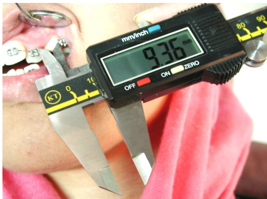
شکل ۲. اندازه‌گیری میزان حرکت دندان با استفاده از کولیس دیجیتال بر حسب میلی‌متر

استفاده صحیح از مسواک و نخ دندان در روز پذیرش هر بیمار به وی آموزش داده می‌شد و در هر یک از مراحل بعدی نیز کاربرد صحیح این وسایل دوباره ارزیابی می‌گردید. پس از ردیف کردن دندان‌ها (به مدت یک ماه)، دستگاه اسلایدینگ برای عقب بردن کاین‌ها مورد استفاده قرار گرفت. تکنیک اسلایدینگ به کمک سیم ۱۶ میل با سطح مقطع گرد استیل و به وسیله زنجیر الاستومریک که نیرویی در حدود 10 \pm گرم به دندان اعمال می‌کرد، اجرا گردید. در هر مرحله فعال سازی، نیرو به وسیله نیروسنج اندازه گیری می‌شد تا نیروی مساوی برای دندان‌ها و در افراد مختلف به کار رود (شکل ۲). به این ترتیب دومین نمونه گیری از مایع شیار لثه‌ای بلافاصله پس از بستن دستگاه‌های فوق انجام شد تا مسطح و ردیف کردن جزئی اولیه ثبت گردد.