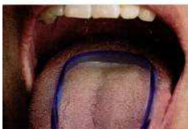
شکل ۲. Scraper زبان [۴۴]