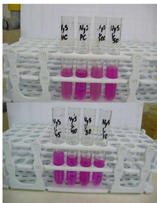
شکل ۲. نتایج تأثیر نیستاتین در رقت‌های مختلف بر لوله‌های آزمایش حاوی کاندیدا آلبیکانس و لوله‌های آزمایش کنترل