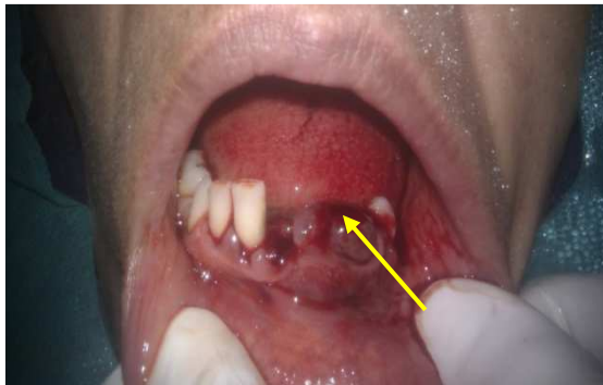
شکل ۳. نمای دهان بیمار پس از جرم‌گیری و خارج کردن دندان‌های درمان‌ناپذیر (پیکان به ضایعه اشاره می‌کند)

به دلیل جرم و پلاک میکروبی و تمایل به خونریزی ضایعه و به منظور پسرقت اندازه ضایعه، ابتدا فاز اول درمان که شامل جرم‌گیری و صاف نمودن سطح ریشه بود، برای بیمار انجام شد. بعد از آن دندان‌های درمان‌ناپذیر (Hopeless) که شامل دندان سانترال و پرمولر اول سمت چپ پایین بود خارج شد (شکل ۳ و ۴).