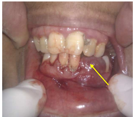
شکل ۱. نمای بالینی ضایعه ژانت سل گرانولومای مرکزی قبل از درمان

بهداشت دهانی بیمار بسیار ضعیف و وجود پلاک میکروبی در نواحی مارژین لثه‌ای کاملاً مشهود بود (شکل ۱). به دلیل خونریزی متعاقب تحریکات مزمن و بیرون‌زدگی بافت نابه‌جا از ساکت دندان، توجه بیمار جلب شده بود. دندان‌های اطراف ضایعه، به دلیل از دست رفتن اتکای استخوانی، لق بودند اما تست‌های حیاتی مؤید زنده بودن دندان‌های مذکور بود. سابقه پزشکی و آزمایشات سرولوژیک و ادرار بیمار نشان داد وی مبتلا به نارسایی مزمن کلیوی است که از چند سال قبل وجود داشته است.