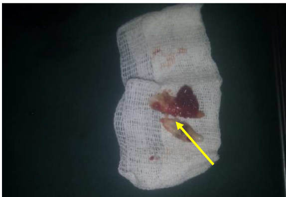
شکل ۴. دندان‌های خارج شده سانترال و پرمولر اول پایین

سپس ضایعه قسمت قدام فک پایین از طریق جراحی اگزیشنال با تیغه بیستوری ۱۵ خارج شده و در فرمالین ۱۰ درصد قرار داده شد و سپس به آزمایشگاه آسیب‌شناسی انتقال داده شد. شکل ۵، نمای بالینی ضایعه را پس از جراحی نشان می‌دهد. ضایعه در نمای ماکروسکوپی، به صورت یک قطعه بافت نرم هرمی شکل گرانولر به رنگ کرم قهوه‌ای با پوشش مخاطی به ابعاد 20 \times 15 \times 15 میلی‌متر قابل مشاهده بود.