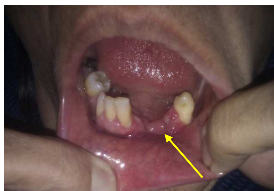
شکل ۵. نمای بالینی پس از برداشت ضایعه

درگیری استخوانی از تظاهرات دیر هنگام هیپر پاراتیروئیدیسم می‌باشد [۲، ۱] به همین دلیل، می‌توان استنتاج نمود که ضایعات ژانت سل فکی بیمار گزارش شده، از