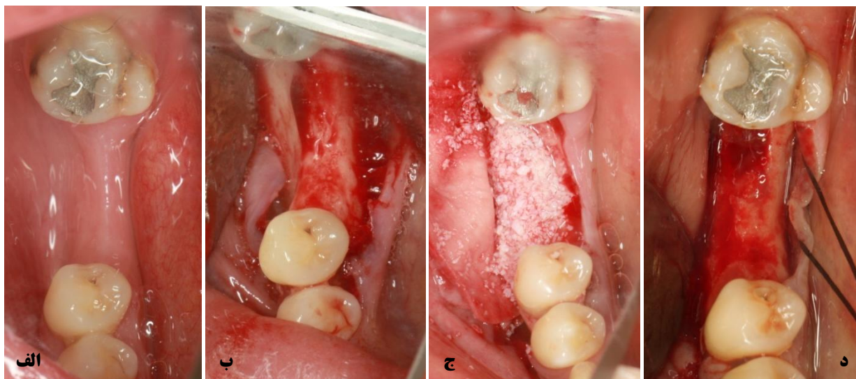
شکل ۱. ناحیه‌ی بی‌دندانی قبل از عمل (الف)؛ ریح آلوئول قبل از بازسازی (ب)؛ جای‌گذاری bio-oss و bio-guide بدون دکورتیکشن بستر (ج)؛ ریح آلوئول بعد از ۷ ماه از بازسازی (د)

هفت ماه بعد از عمل، در نواحی از قبل اندازه‌گیری شده، فلپ جهت جراحی ایمپلنت و ثبت اندازه‌گیری جدید باکولینگوالی کنار زده شد. یک یا دو نمونه بیوپسی به‌صورت Core استخوانی توسط فرز Trepphine (Dio, Collombey, Switzerland) ۳ میلی‌متری با طول ۱۲ میلی‌متر، در ۸ میلی‌متری از کنار محلی که قرار بود ایمپلنت قرار گیرد به‌صورت افقی، برداشته شد (منطقه قرار دادن Bio-Oss از لبه کرسنال تا عمق بیش از ۱۲ میلی‌متر بود ولی پخش شدن گرانول‌ها در جهت اپیکال باعث شده بود ارتفاع ۸ میلی‌متری مناسب‌ترین محل بیوپسی باشد). و سپس آماده‌سازی حفرات ایمپلنت انجام گردید (شکل ۱ ج و شکل ۲).