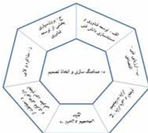
شکل ۲) الگوی فرآیند تجاری سازی فناوری در پژوهشگاه های دولتی ایران