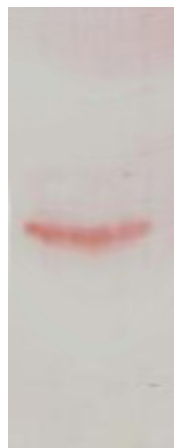
شکل ۳. وسترن بلات پروتئین سطحی ۳۱ کیلودالتونی