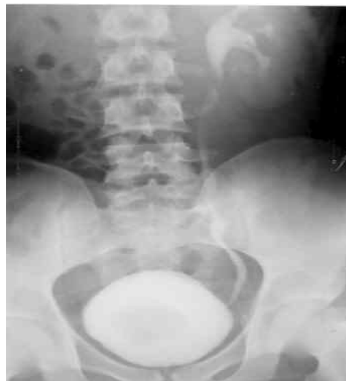
شکل ۳: IVP نشان دهنده عدم ترشح در کلیه راست می باشد (آرنزی کلیه راست)

اورتروسل بزرگ با آرنزی کلیه همان طرف از موارد نادر می باشد. اغلب اورتروسل ها (۸۰٪) همراه با دوگانگی حالب و عمدتاً متصل به حالب قطب فوقانی کلیه ها بوده و بیشتر اورتروسل ها اکتوپیک می باشند (۸۰-۶۰٪). اورتروسل ها در نتیجه کاهش المان های عضلانی - کلاژنی جدار و باز شدن ناکافی سوراخ آن (اختلال در تکوین پرده chwała) دچار اتساع می گردند. کشف اورتروسل ها اغلب با علائم ادراری در دوران طفولیت و حتی در برنامه های غربالگری پیش از تولد با سونوگرافی صورت می گیرد. بیمار معرفی شده دچار یک اورتروسل بزرگ (۶×۵ سانتی متر) بود که به دلیل پیدایش علائم در سن بالا احتمالاً به تدریج افزایش حجم پیدا کرده بود. در این بیمار اورتروسل همراه با عدم تشکیل کلیه همان طرف بود که می تواند ناشی از عدم رشد جوانه حالبی به طرف سر جنین باشد. اورتروسل های داخل مثانه در ۸۰٪ موارد قابل درمان از راه سیتوسکوپ می باشند ولی در مورد گزارش شده، به دلیل بزرگی آن و پیش بینی احتمال سستی جدار مثانه در قاعده این اورتروسل بزرگ، عمل باز از راه مثانه برای حذف و ترمیم کف مثانه ترجیح داده شد.