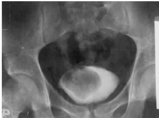
شکل ۴: در سیتوگرام توده ای با سایه منفی در مثانه دیده می شود