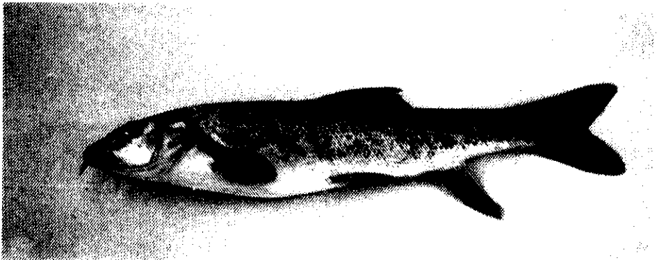
شکل ۳: Barbus lacerta cyri

پراکنش در استان: رودخانه‌های مردانقم، اهرچای، کلیبرچای، ارس، ایلگنه چای، حاجیلرچای، تلخه رود، مردق چای، صوفی چای، قلعه چای، آیدوغموش، قرانقو، قزل‌اوزن (قاسمی ۱۳۷۹، ۱۳۷۷، ۱۳۷۵).