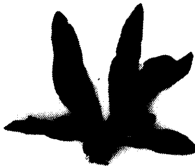
Nizimuddinia zanardini (Schiffner) P. Silva in Silva et al.

شکل ۱: سه گونه مورد مطالعه از جلبکهای قهوه‌ای در سواحل استان سیستان و بلوچستان