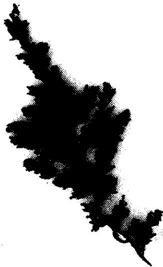
Sargassum glaucescens J.Ag.