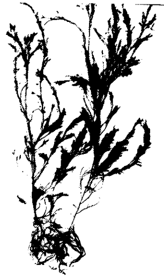
Cystoseira indica Thivy et al.